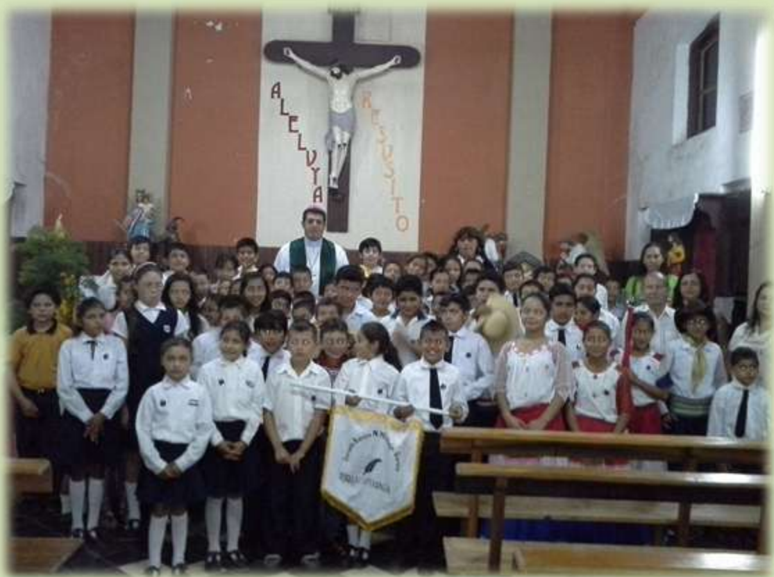
Alumnos de la Escuela Nacional de Puerto La Esperanza “Alejo García”, participando en uno de los días del novenario en la parroquia.