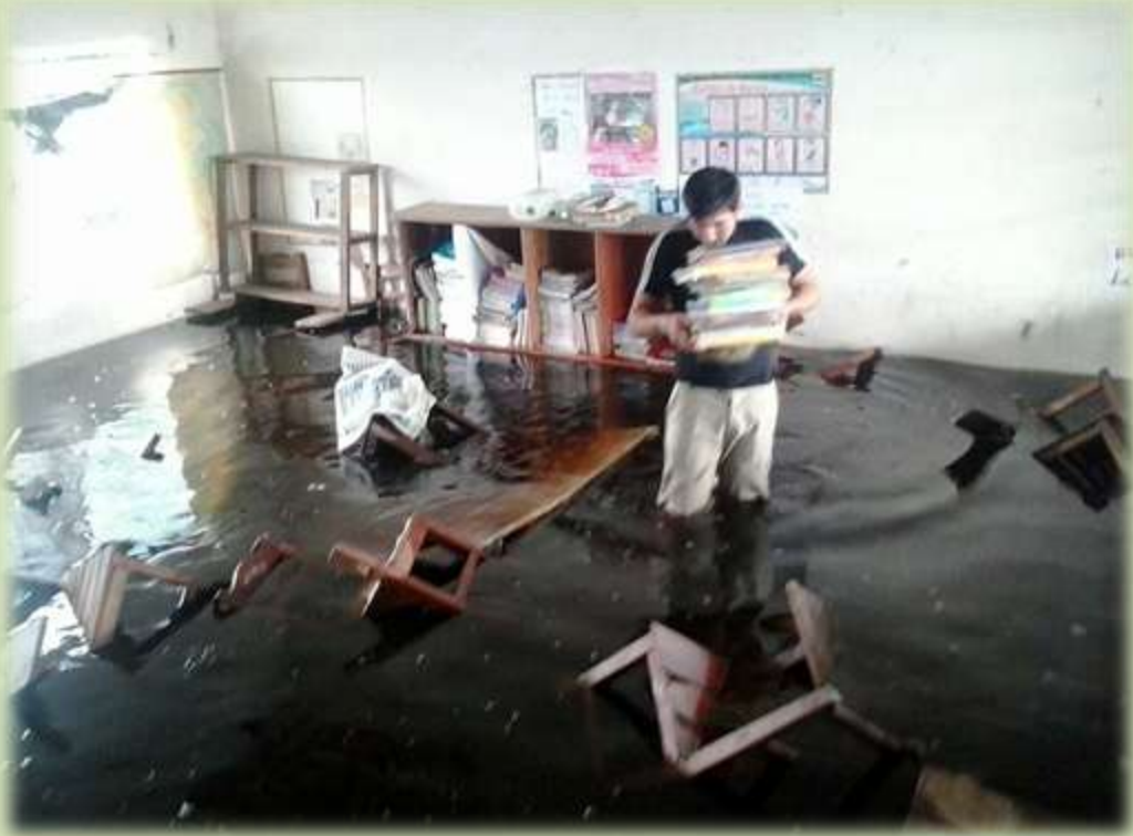
FUERTE OLIMPO, ALTO PARAGUAY- BARRJO SAN MIGUEL BARRERITO