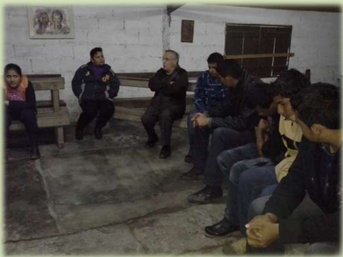
Jóvenes del Grupo Juvenil de la Parroquia San Pedro del Puerto La Esperanza.