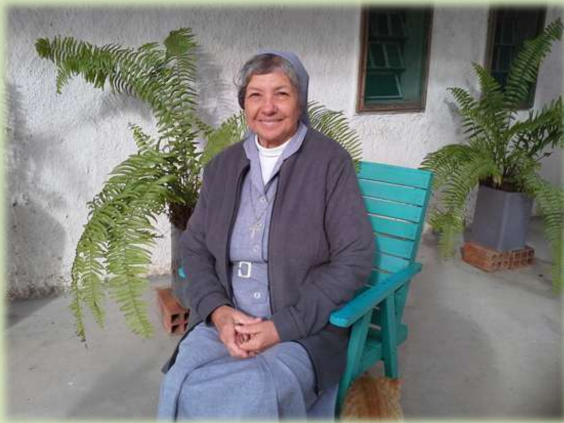
Paraguay, Religiosa Salesiana y Misionera en el Chaco