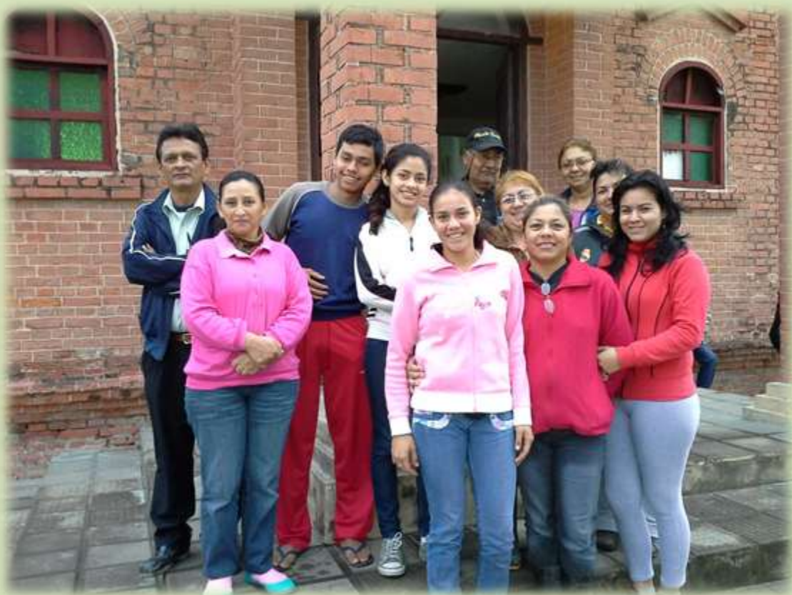
Catequistas de la comunidad Parroquial de San Pedro de Puerto La Esperanza.