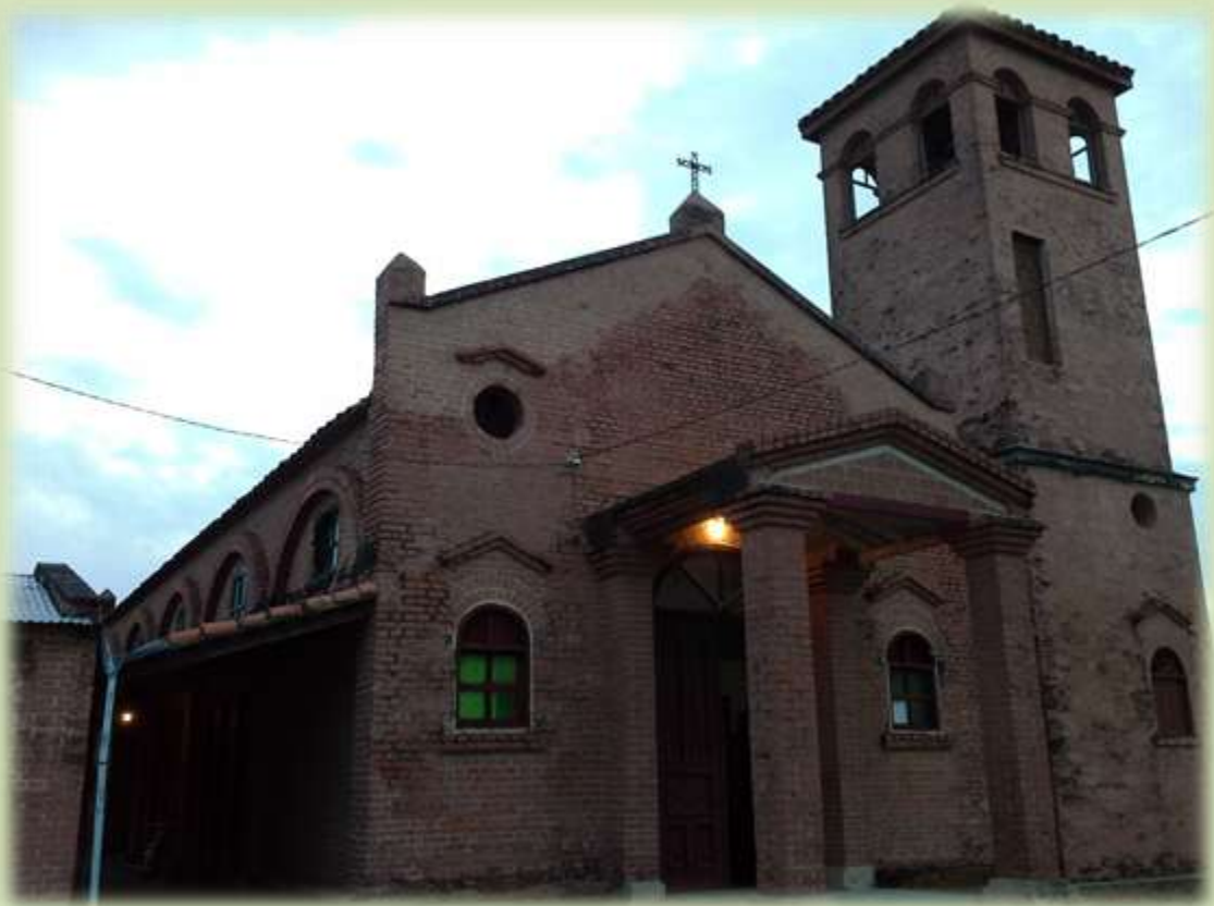
Frontis del Hermoso Templo de la Parroquia San Pedro en el Puerto La Esperanza. Estilo ferroviario.

Desde el miércoles de tarde con la misa parroquial se dio inicio a la visita pastoral del Obispo a esta comunidad cristiana, donde tuvo la oportunidad de visitar varias instituciones y conversar con las personas. Reuniéndose con varios agentes de pastoral, monaguillos, jóvenes, educadores, comisión de la parroquia.