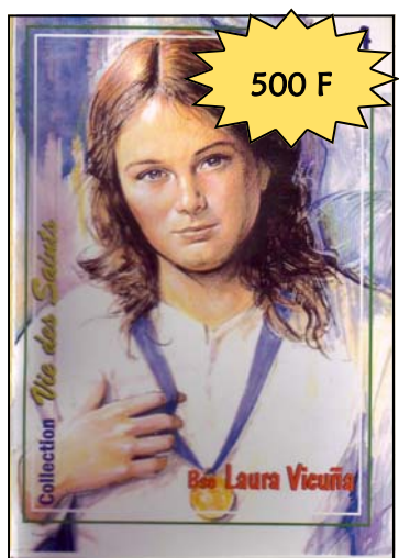
La vie de la Bse Laura VICUÑA