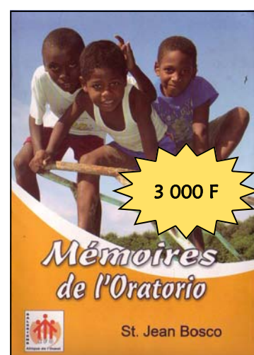
Mémoires de l'Oratorio Par Jean BOSCO