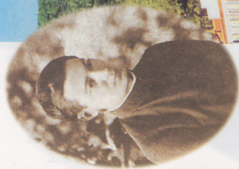
Kolegium w Lanzo