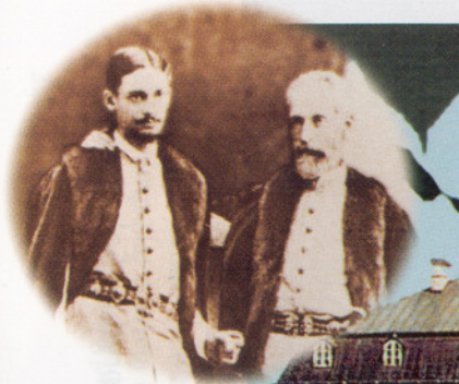
Pałac w Sieniawie