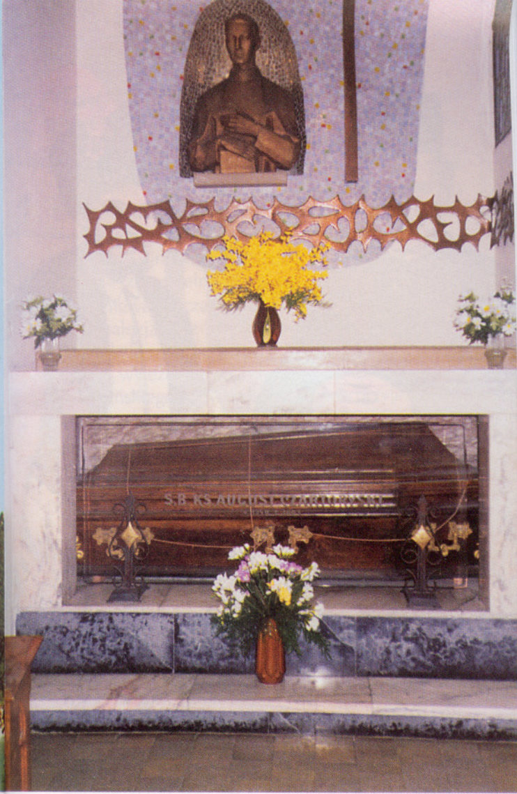
Relikwie Błogosławionego Augusta Czartoryskiego