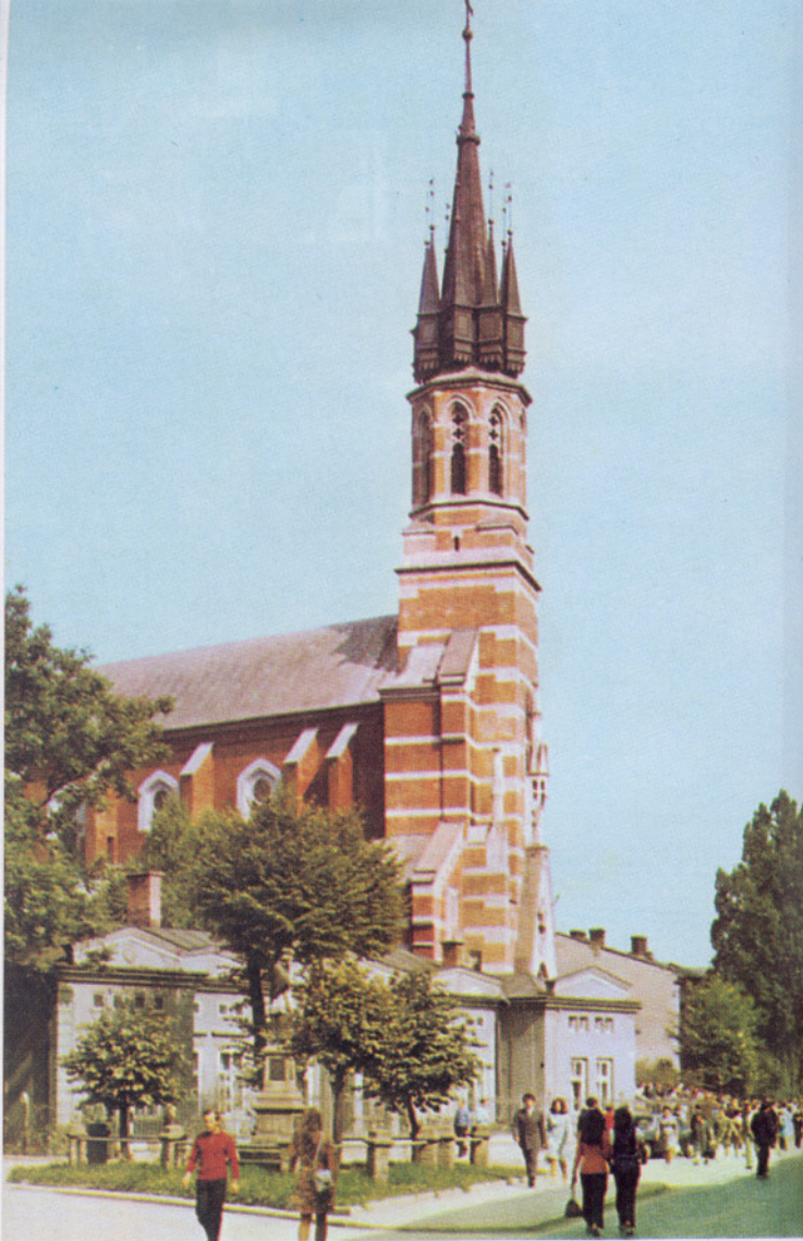
Przemyśl – Kościół św. Józefa