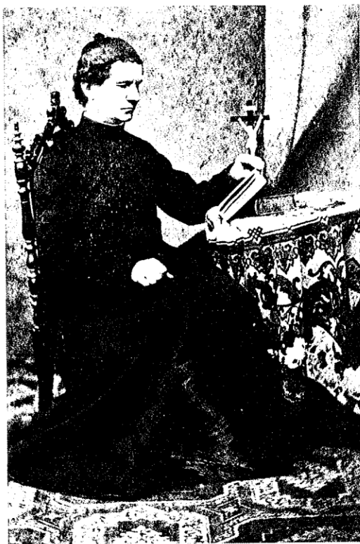
Don Bosco giovane sacerdote. Nella foto a sinistra, il Santo porta un colletto alla francese mentre nell'immagine a destra (forse dei tempi del Convitto Ecclesiastico), appare assorto nello studio.