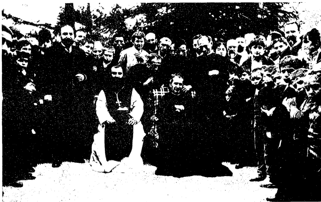
Don Rua, primo successore del Santo, si china verso Don Bosco in un giardino di Barcellona. A destra, i ragazzi della casa salesiana di Sarriè. Il tempio salesiano del Sacro Cuore sul Monte Tibidabo (sotto) perpetua il ricordo della visita del Santo.