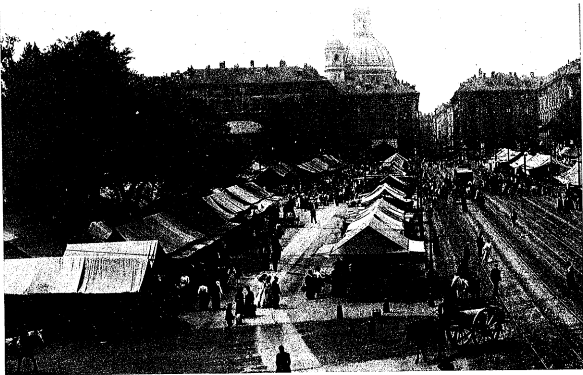
Due rare rare immagini di luoghi della Torino ottocentesca legati a ricordi del Santo. In alto, Porta Palazzo, dove la città finiva e una guardia si offriva spesso di accompagnare Don Bosco per la pericolosa strada di Valdocco. Sotto, Piazza San Carlo, dove il Santo offrì un caffè ai quattro giovani sbandati incontrati sui prati dietro Porta Nuova.