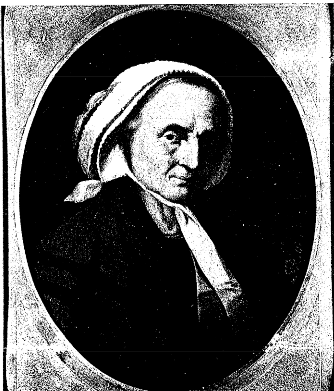
«È proprio Lei, le manca solo la parola» I esclamò Don Bosco vedendo questo ritratto di sua madre dipinto dal Rollini nel 1855.