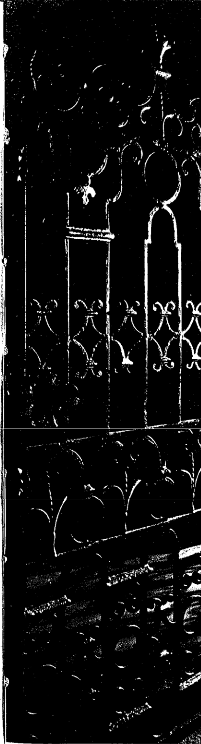
Nella vita di Don Bosco, pochi Francesco d'Assisi a Torino. Quella notte del 1841, il Santo vide un garzone di muratore analfabeta,

appariva chiaramente — regolavano il loro passo sul suo. « Brutto affare! » pensò Don Bosco. Stava per ritornare sui suoi passi per raggiungere un luogo più frequentato, quando i due gli si precipitarono addosso e gli incappucciarono la testa con un sacco. A furia di dibattersi Don Bosco riuscì a liberarsi ma il più robusto era già riuscito a mettergli alla bocca un bavaglio che rischiava di soffocarlo e gli impediva in ogni caso di chiamare aiuto. Stava per crollare a terra senza più forze, semi asfissiato, quando si udì nel buio il terribile ringhio del Grigio . In un minuto Don Bosco era libero, e mentre uno degli aggressori scappava, l'altro stava disteso a terra con l'animale ansante a pochi centimetri dalla gola.