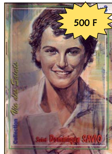
La vie de saint Dominique SAVIO