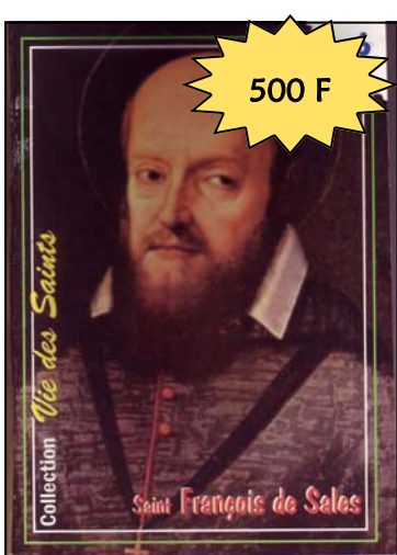
La vie de saint François de SALES