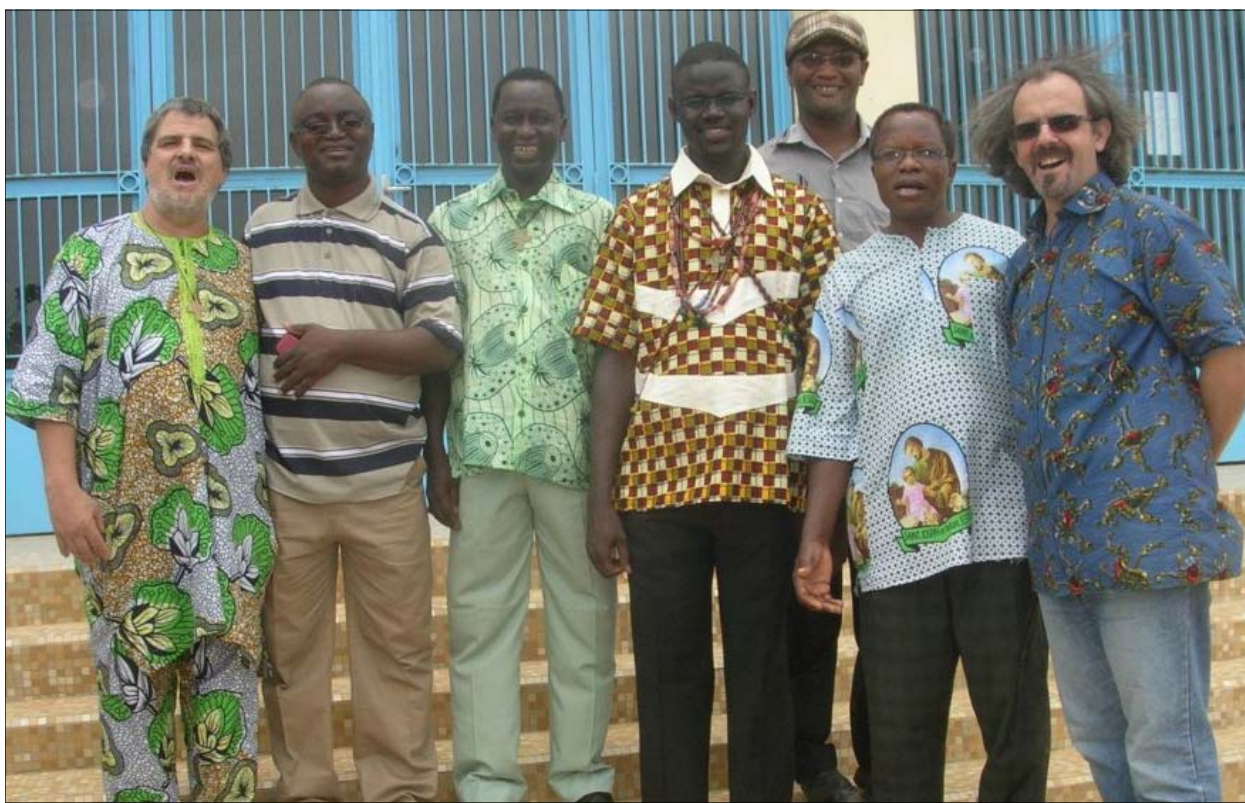
Le néo profès perpétuel entouré des confrères présents au Sénégal et du Provincial