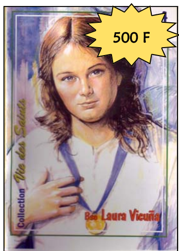
La vie de la Bse Laura VICUÑA