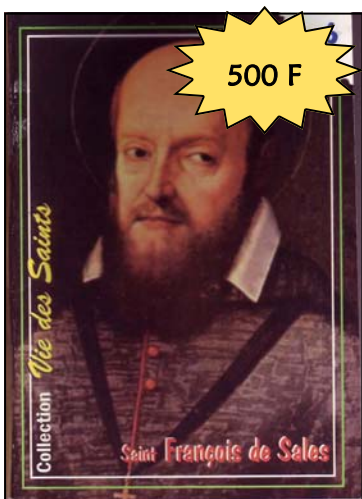
La vie de saint François de SALES