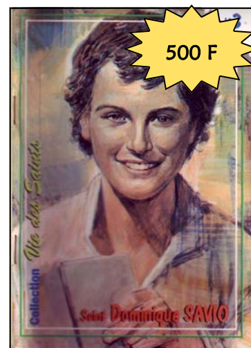
La vie de saint Dominique SAVIO