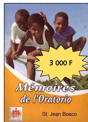
Mémoires de l'Oratorio Par Jean BOSCO