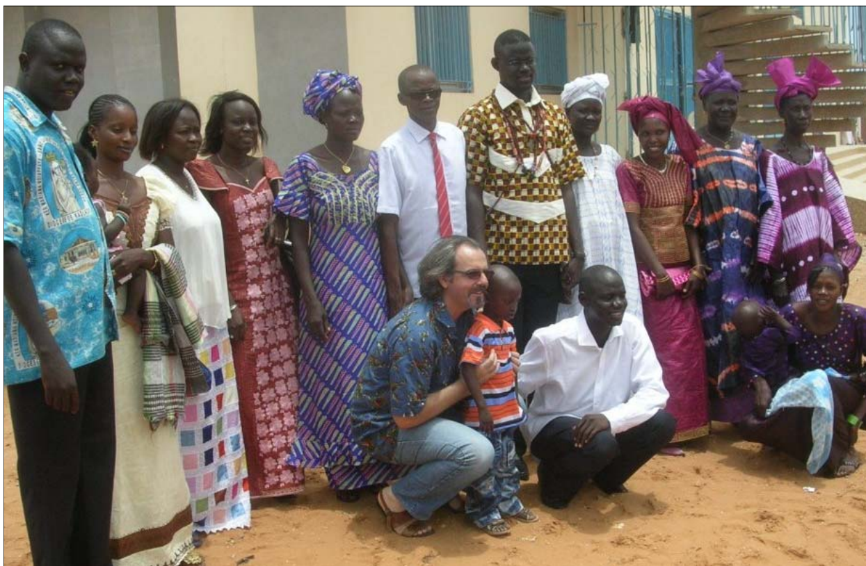
Photo avec la famille du néo profès et le Provincial