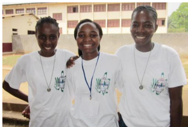
L'amitié et la joie caractérisent la Spiritualité Salésienne des Jeunes