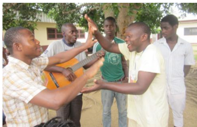
Un moment de récréation pendant lequel les jeunes se souviennent de l'enfance