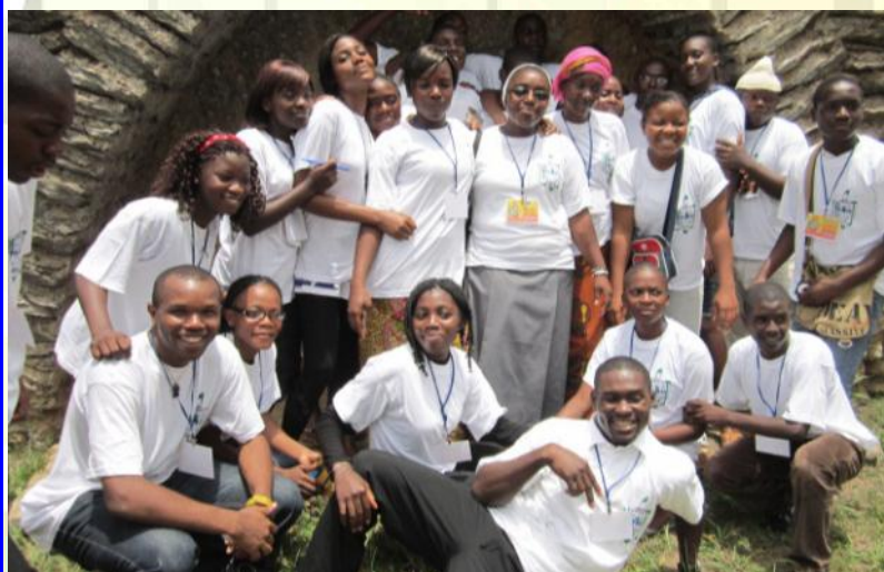
Mouvement Salésien de Jeunes à Mbalmayo