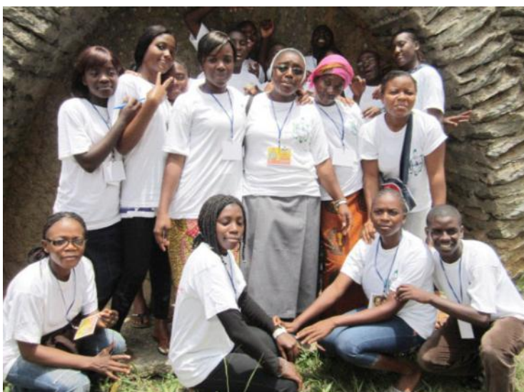
L'heure est aux photos souvenirs afin d'immortaliser ces moments agréables