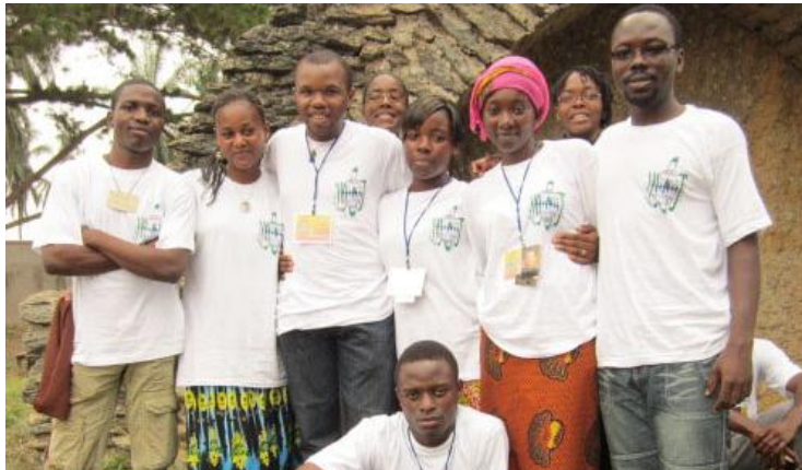
On est heureux d'être ensemble pour prier ensemble, discuter ensemble et témoigner ensemble de notre foi