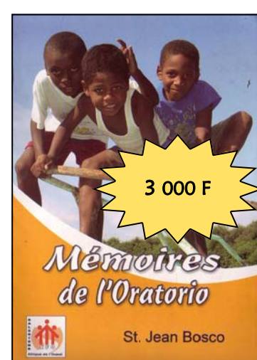
Mémoires de l'Oratorio Par Jean BOSCO