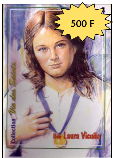
La vie de la Bse Laura VICUÑA