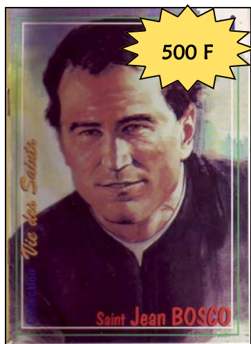
La vie de saint Jean BOSCO