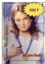
La vie de la Beate Laura VI. CLINA