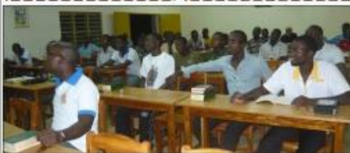
février 2013 (024)

Le but de la société salésienne est la sanctification personnelle et l'éducation des jeunes. Ainsi, venons-nous invités à vivre la primauté de Dieu, à rechercher la sainteté, la cohésion ; à repartir du Christ, à être dans le monde signe et porteur de l'Amour de Dieu par notre rénovation spirituelle ; car nous sommes des adorateurs de Dieu à partir de la contemplation de Don Bosco.