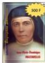
La vie de saint Marie-Dominique MAZZARELLO