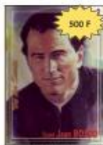
La vie de saint Jean BOSCO