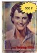
La vie de saint Dominique SAVO