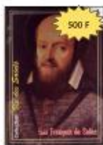
La vie de saint François de SALES