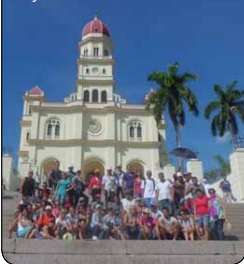
Peregrinos en el Santuario Nacional del Cobre

Durante el recorrido, el cual incluyó una breve estancia en el poblado de Barajagua, sitio en el que la Virgen tuvo su primera casa antes de ser trasladada cerca de las Minas del Cobre, los peregrinos pudieron compartir con fieles de las comunidades de Cueto, Alto Cedro y Palma Soriano, en quienes encontraron acogida fraterna y auténtica hermandad cristiana.