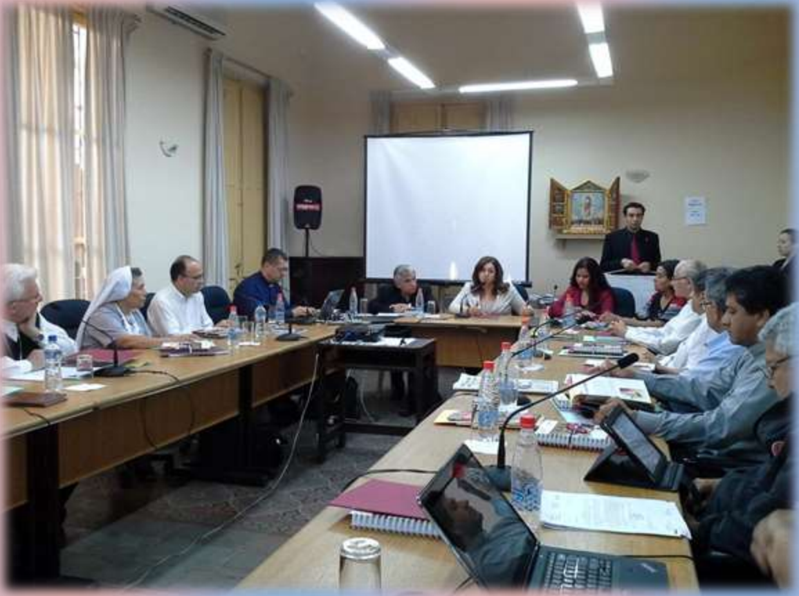
Visita de la Ministra de Educación Marta Lafuente con sus viceministros para presentar su proyecto de trabajo de estos años.