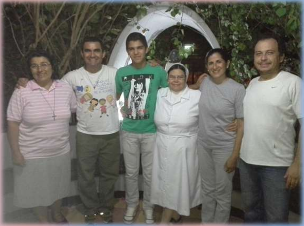
Posando los miembros del Movimiento Eucarístico Juvenil con las Hermanas Salesianas de Forte Olimpo.