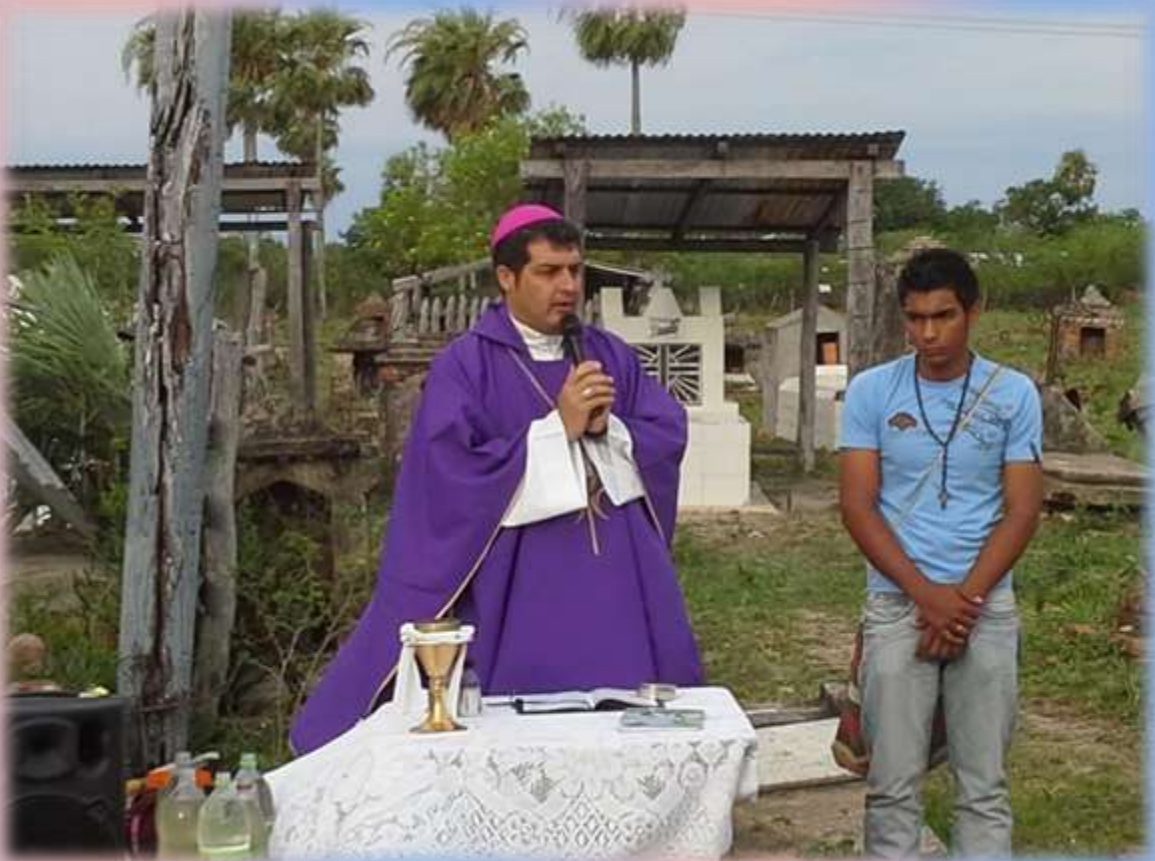
“Dale Señor el descanso eterno y brille para ellos la luz perpetua, que descansen en paz. Amén”