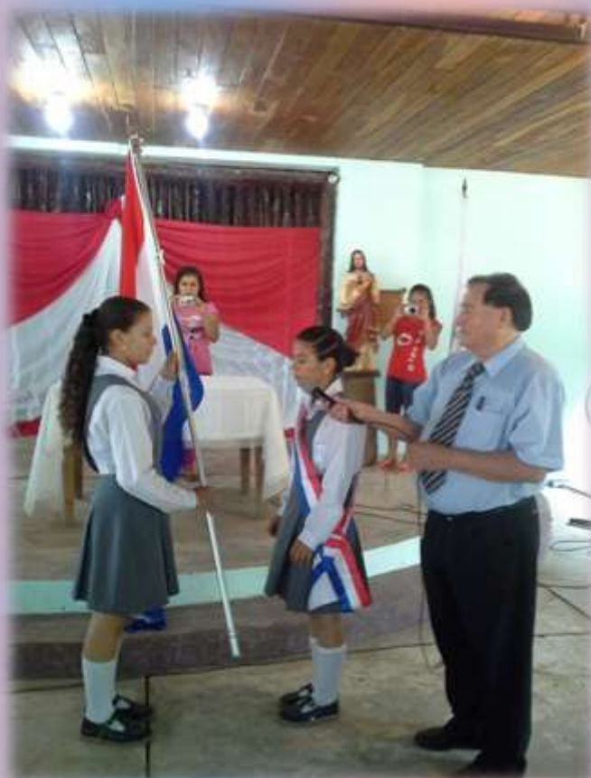
Entrega del Pabellón Patrio a la mejor alumna del Segundo Curso de la Educ. Media.