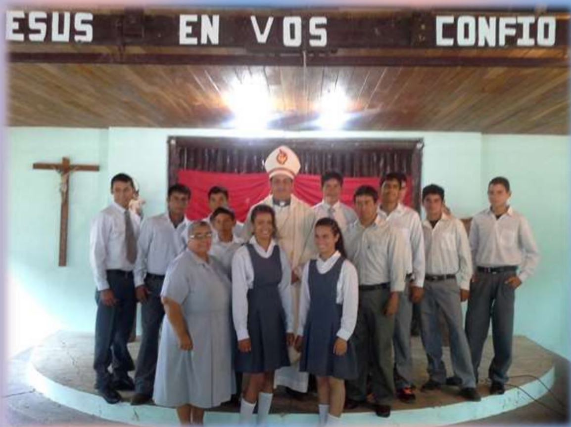
ACTO DE GRADUACIÓN Y ENTREGA DE TÍTULO