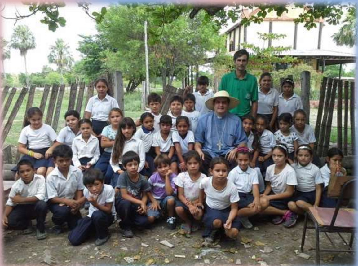
Después de los juegos posando para la Revista del Vicariato con los niños de la escuela del pueblo.