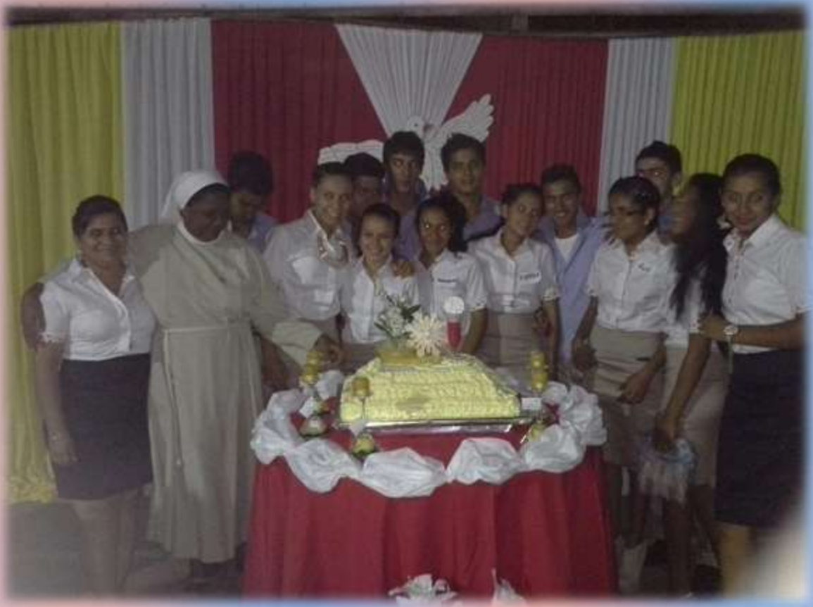
En horas de la tarde del domingo 16 de noviembre en la SEDE PARROQUIAL DE PUERTO PINASCO se llevó a cabo la celebración del SACRAMENTO DE CONFIRMACIÓN .