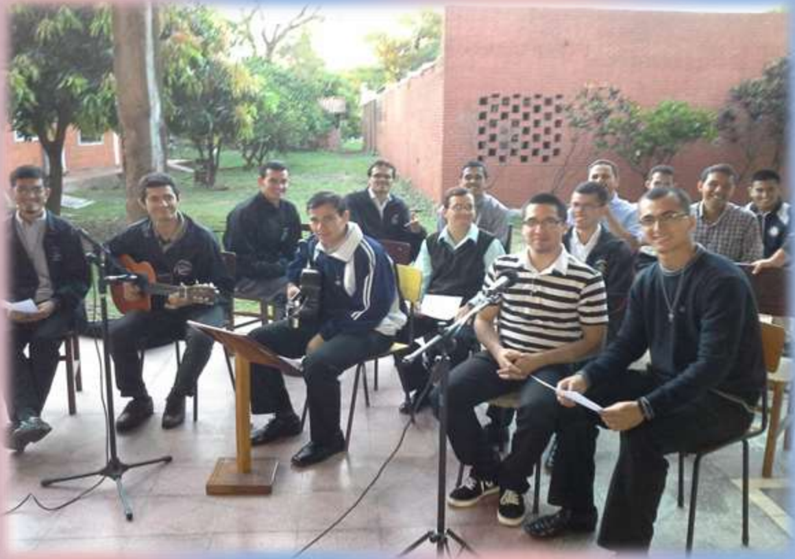
Grupo coral del Seminario Mayor de Asunción compuesto por seminaristas de las distintas diócesis del país.