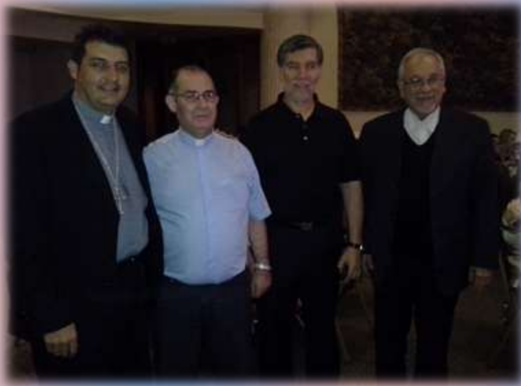
Estuvieron presentes varios sacerdotes de la Arquidiócesis.