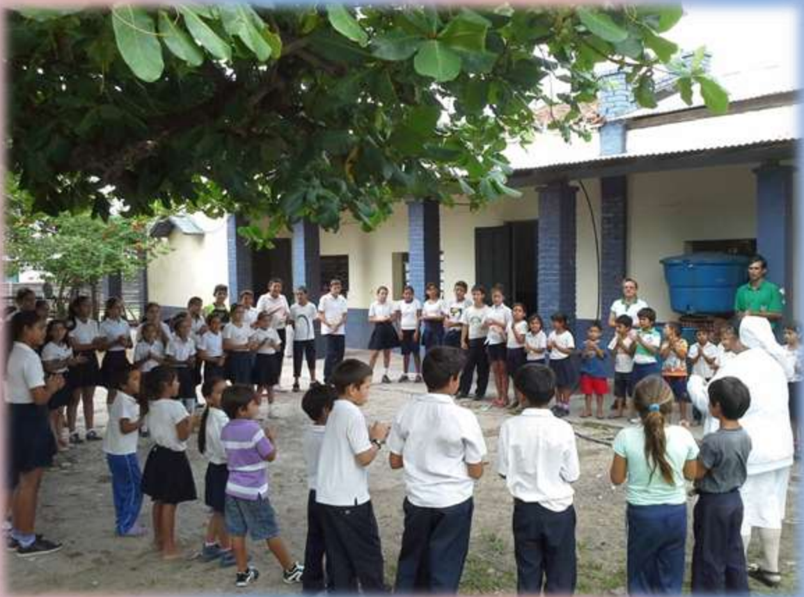
La tristeza y la melancolía fuera de la casa mía. La alegría y los juegos son condimentos que nos ayudan a fortalecer la autoestima del niño.