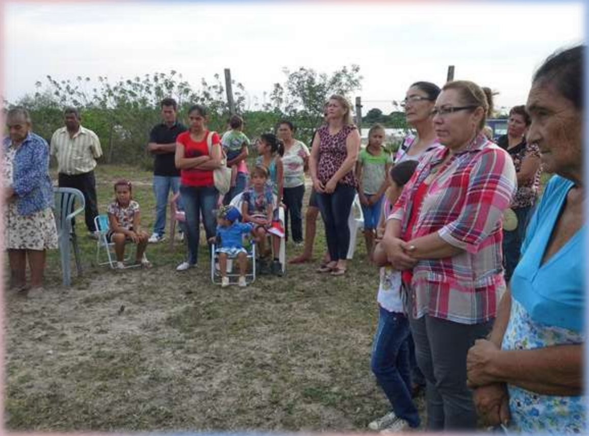
Misa por los fieles difuntos en el Cementerio de la comunidad.