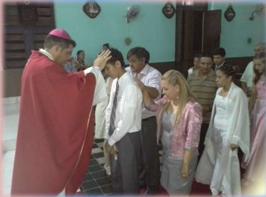
Con mucha devoción y unción recibieron los jóvenes de la Parroquia el sacramento de la Confirmación por manos de Mons. Gabriel Escobar.