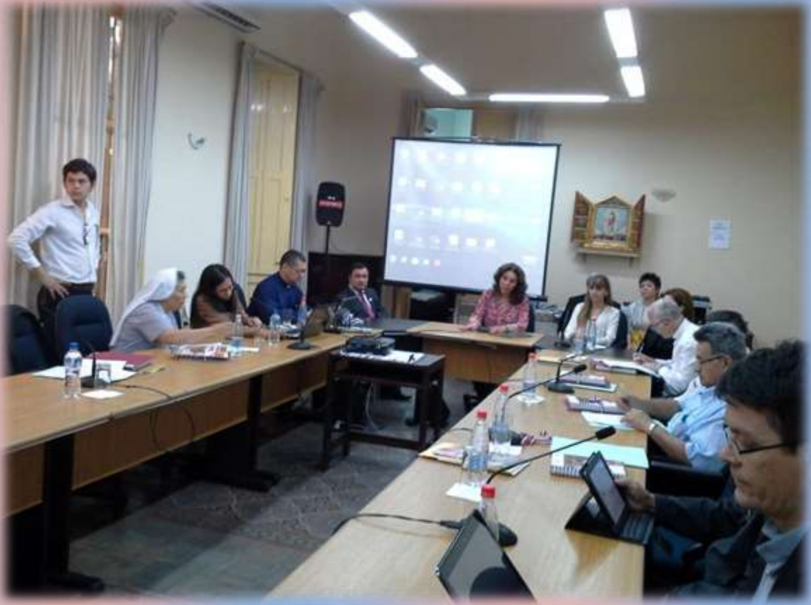
Visitó también a los obispos en su Asamblea Ordinaria la Ministra de Justicia, Sheila Abed.