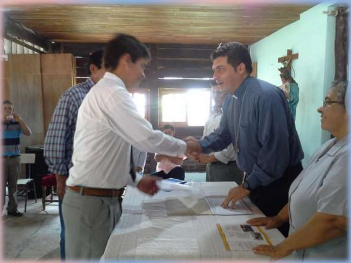
Entrega de títulos a los alumnos del colegio