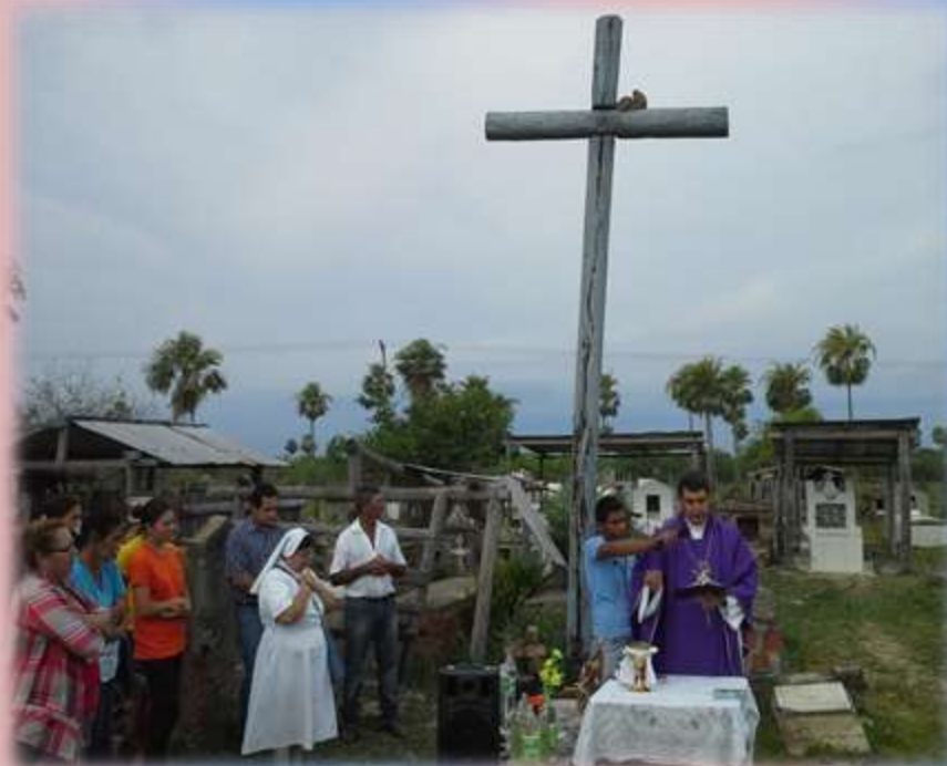
COLONIA ÁNGEL MUZZOLÓN – CAPILLA CAACUPE