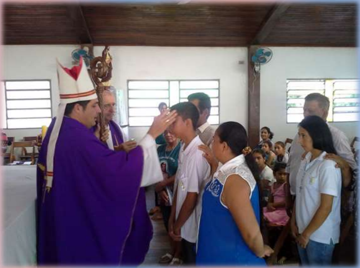
Momento de la Crismación, donde uno está llamado a ser otro Cristo en su vida y el de los demás.