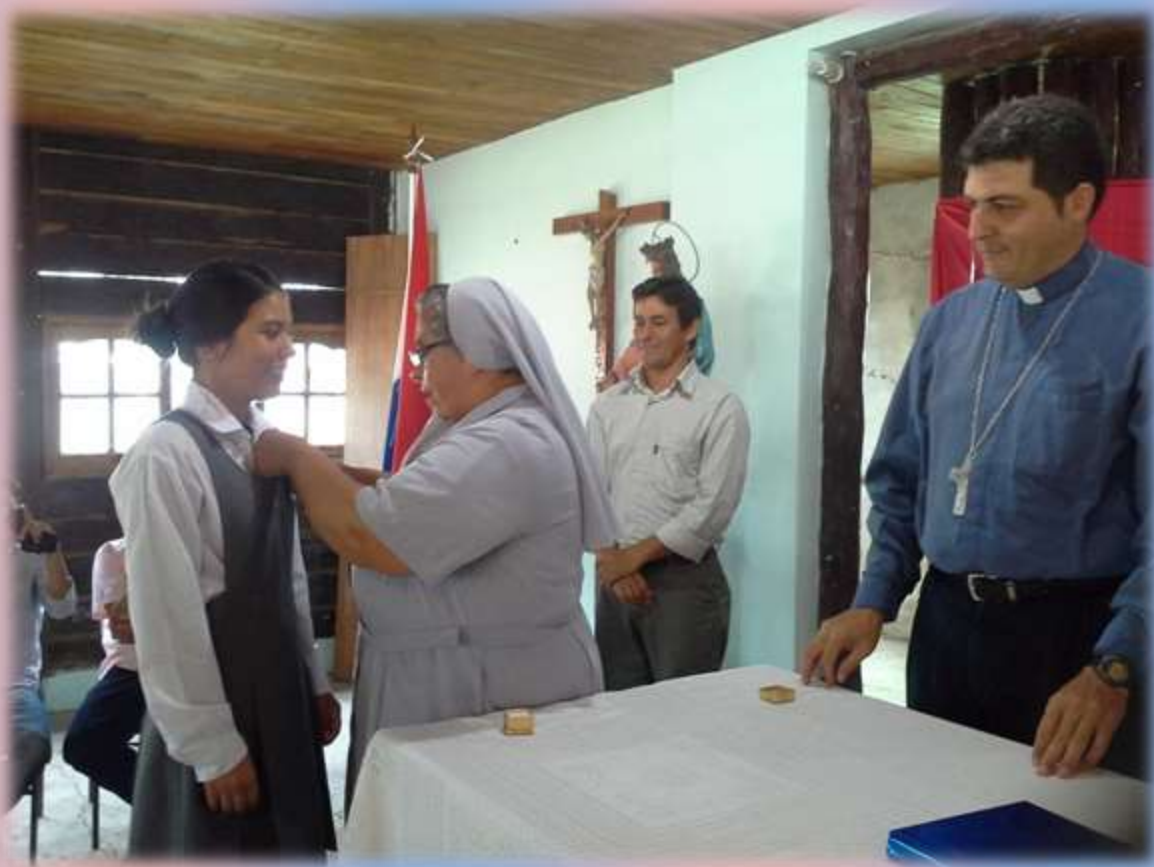
ENTREGA DE LA MEDALLA DE ORO A LA MEJOR EGRESADA DE LA PROMOCIÓN 2014