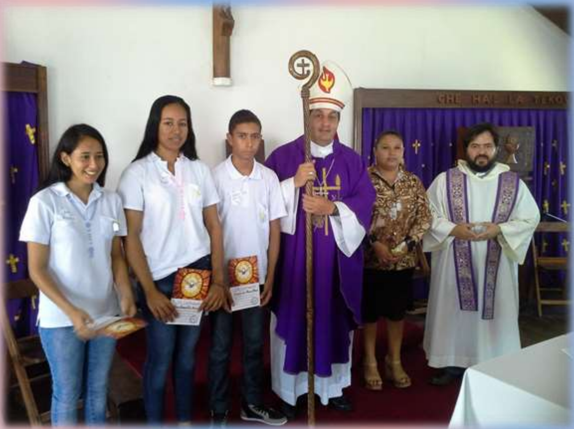
Los nuevos soldados para Cristo, al servicio de la Iglesia de Carmelo Peralta.