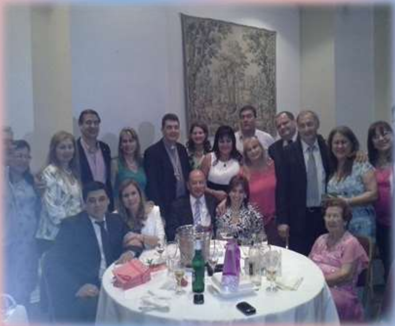
Miembros de Asociación de Padres del Salesiano