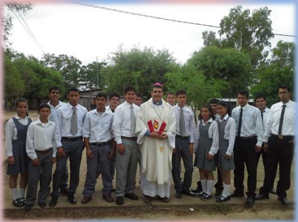
Jóvenes Egresados del Bachillerato Técnico en Agricultura