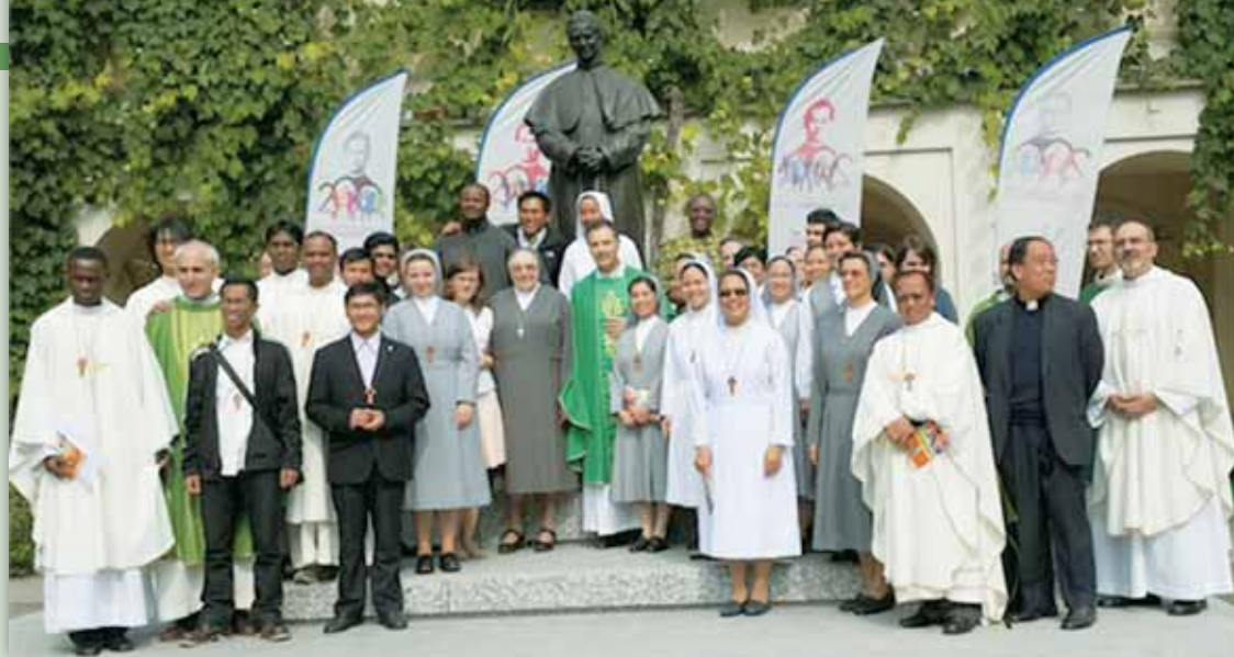
Au Valdocco, le Recteur Majeur et la Mère Générale des salésiennes viennent de remettre la croix missionnaire aux membres de la 145 e expédition missionnaire.