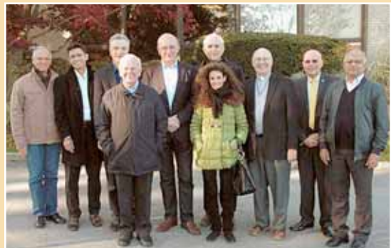
États-Unis, New Rochelle, NY : rencontre des directeurs des procures internationales