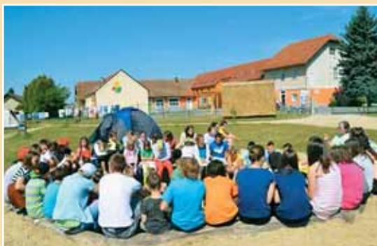
Slovénie, Verzej : jeunes de l' Inst. Salésien Marianum