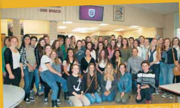
Voyage à NY: un arrêt à Don Bosco Prep High School, Ramsey, NJ