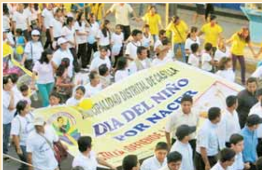
Pérou, Piura : manifestation de jeunes en défense de l'enfant à naître.