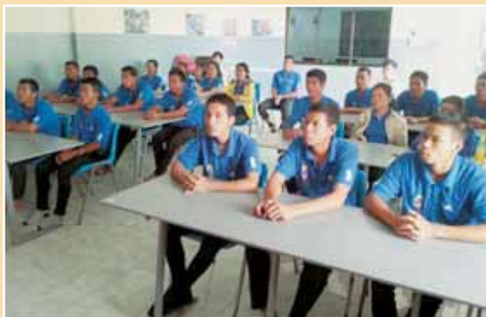
Cambodge, Poipier : étudiants de l'Inst. Technique Salésien