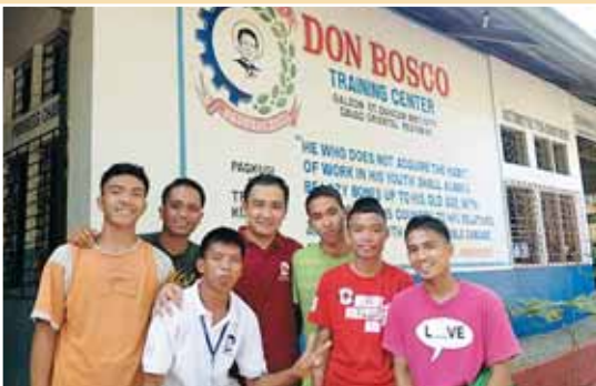
Philippines, Mati-Davao : directeur du DB Training Centre avec étudiants