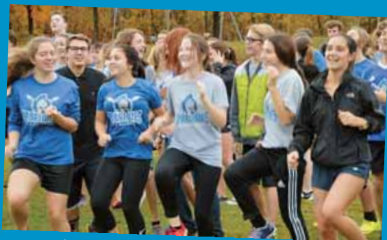
Journée cross-country 3 e et 4 e secondaires