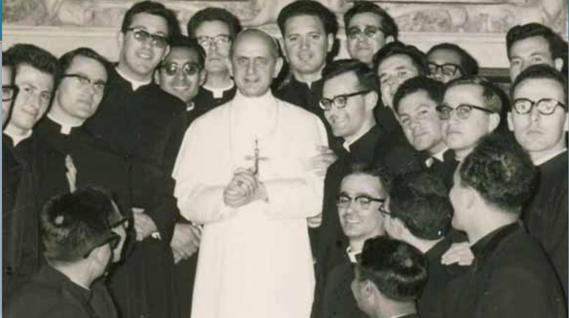
Pape et nouveaux ordonnés salésiens : classe UPS 1966

Soyez vraiment salésiens ! Vous ne savez pas combien de personnes, combien de rencontres passent autour de nous ! mais votre rencontre nous émeut de manière particulière et nous donne la joie et l'espoir que l'Église aujourd'hui soit vraiment celle de Don Bosco, une Église vivante ».