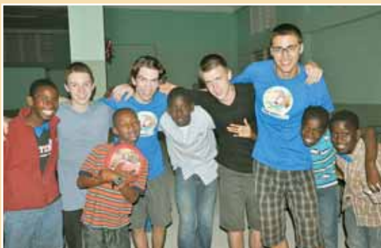
Haiti, Gressier : étudiants du Séminaire Salésien de Sherbrooke avec enfants de l'école