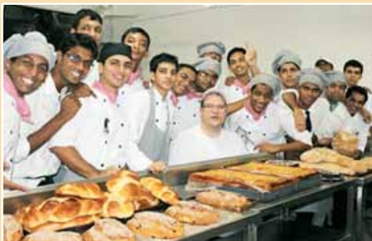
Inde, Mumbai : formation de futurs boulangers au DB College Hosp. Centre