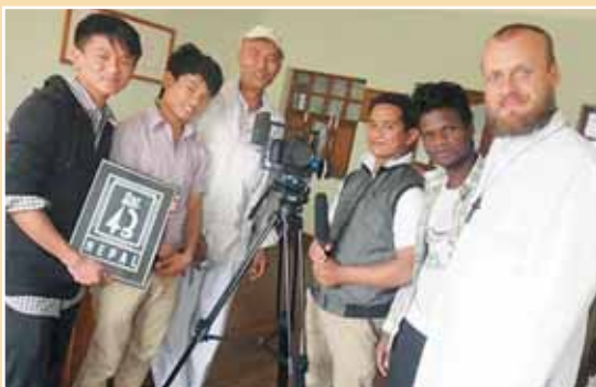
Népal, Katmandou : membres du Salesian Media Club