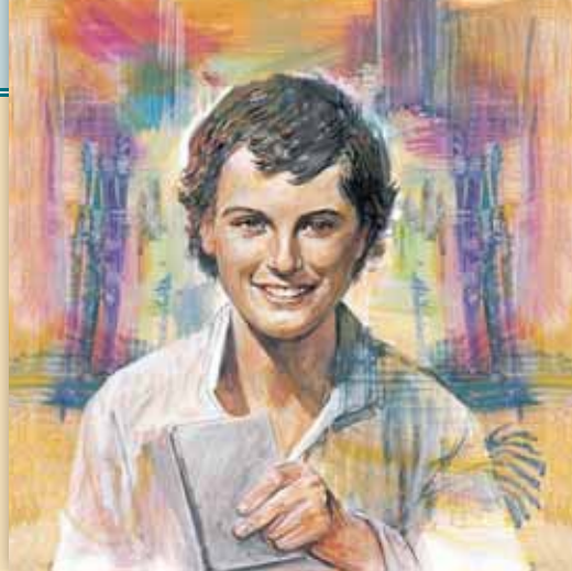
Saint Dominique Savio, élève de Don Bosco

me semble très vraie et éloquente : “L’Église se réveille dans les âmes” L’Église vit, grandit et se réveille dans les âmes qui, comme la Vierge Marie, accueillent la Parole de Dieu et la conçoivent sous l’action de l’Esprit Saint ; qui offrent à Dieu leur propre chair et qui, précisément dans leur pauvreté