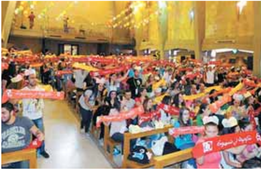
Syrie, Alep : ville en guerre – espérance malgré tout.