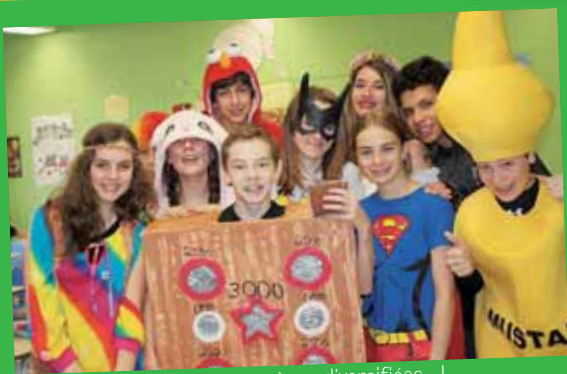
Halloween: espèces diversifiées...!