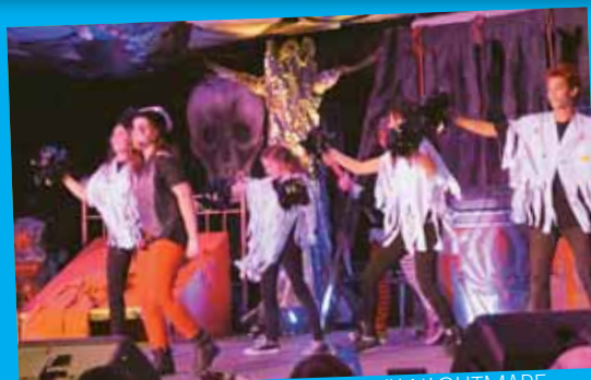
On joue le musical, COME TO MY NIGHTMARE, d'Alice Cooper