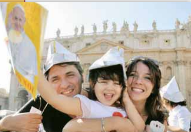
Journée de la Famille, Place St-Pierre, Vatican

Du 5 au 19 octobre s'est déroulé à Rome le synode sur la famille. Présidé par le Pape François, il rassemblait plus de 200 personnes : cardinaux, évêques, invités d'autres Églises, laïcs, couples. Voici l'introduction du document provisoire rédigé à mi-chemin du synode. Ce synode reprendra dans un an.