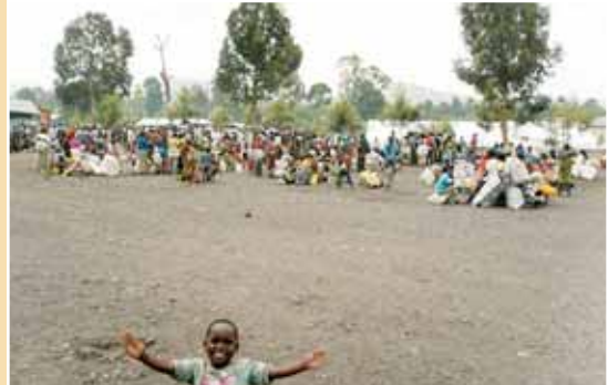
République du Congo, Goma : paroisse salésienne devenue camp de réfugiés