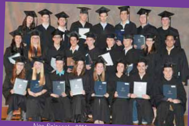
Nos finissants 2014: remise des diplômes