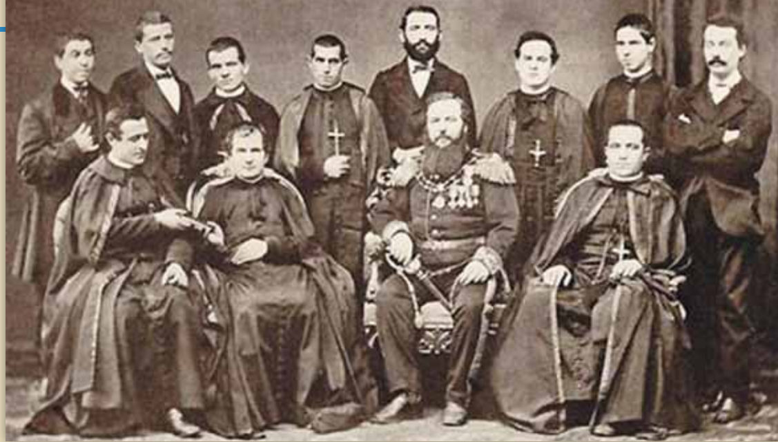
Premier départ missionnaire vers la Patagonie en 1875 en présence de Don Bosco (1 re rangée, 2 e à gauche ; à sa gauche l'ambassadeur de l'Argentine).