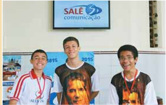
Brésil, Bahia : étudiants heureux d'apprendre