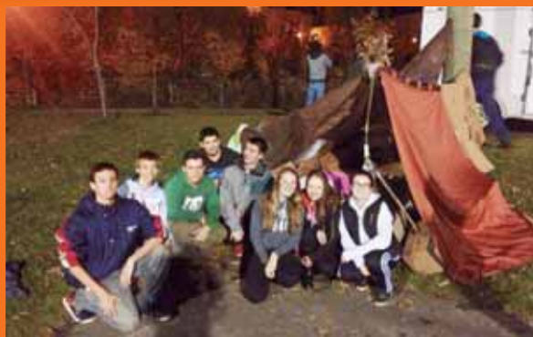
Education sociale: expérience des sans-abri au Parc Camirand