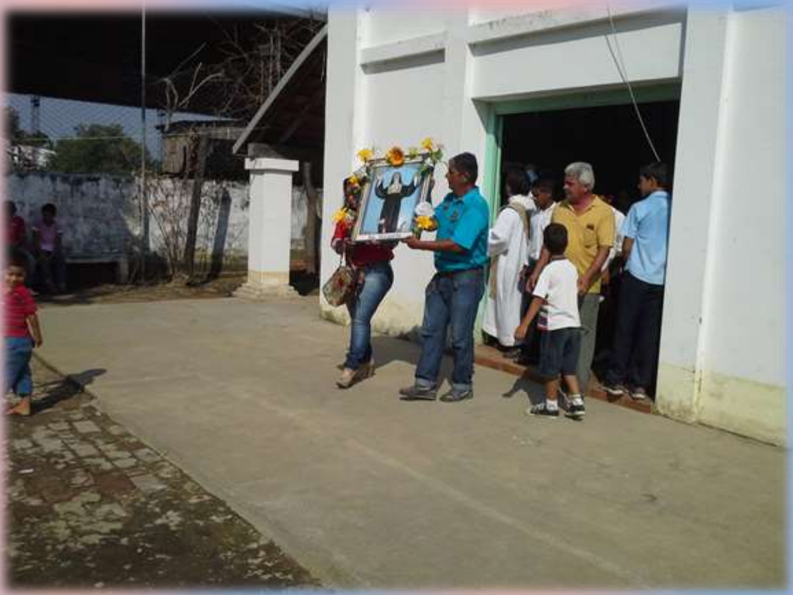
Inicio de la Procesión de la Imagen al final de la Santa Misa.