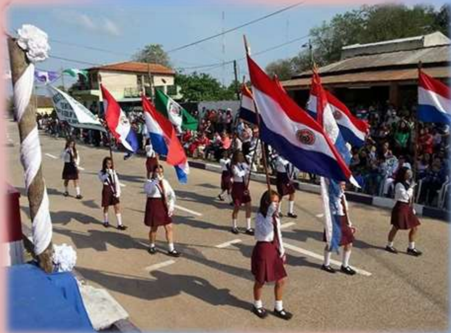
Bandalisa de una de las instituciones participantes