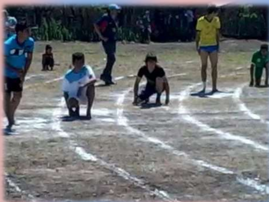
Momentos de las Olimpiadas, corrida de velocidad.