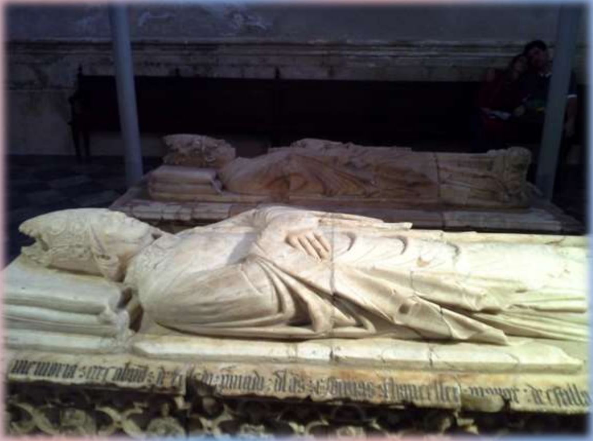
Lugar donde descansa el Obispo San Blás. Iglesia Catedral de Toledo. Patrono del Paraguay.