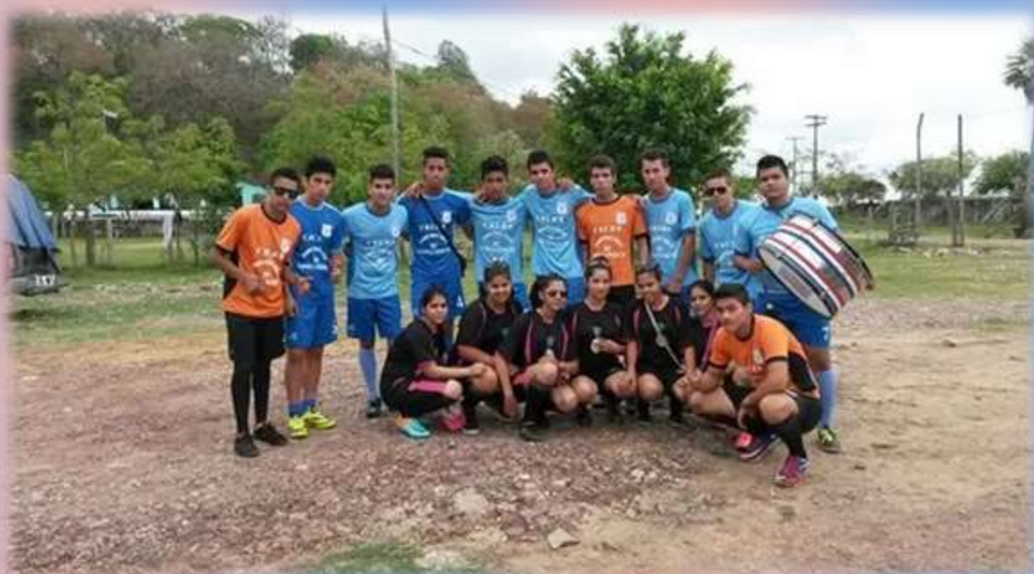
Hinchada del Colegio Nacional de Carmelo Peralta.