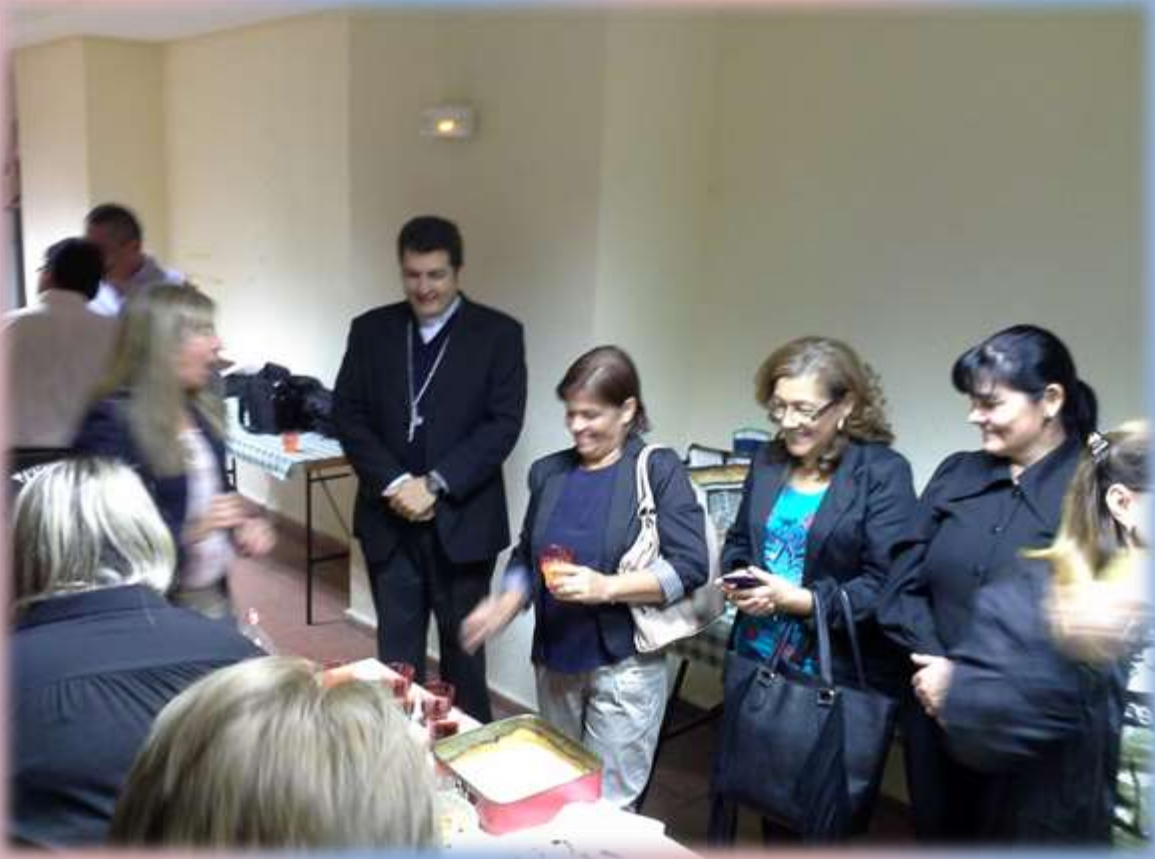
Brindis un momento de compartir con los compatriotas paraguayos residentes en Madrid, al término de la Misa en la Parroquia de la Paloma.