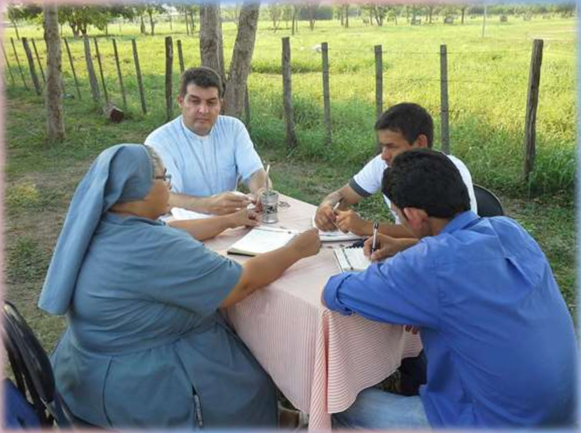
Reunión con el Consejo Directivo de la Escuela Agrícola de Ñuapua.