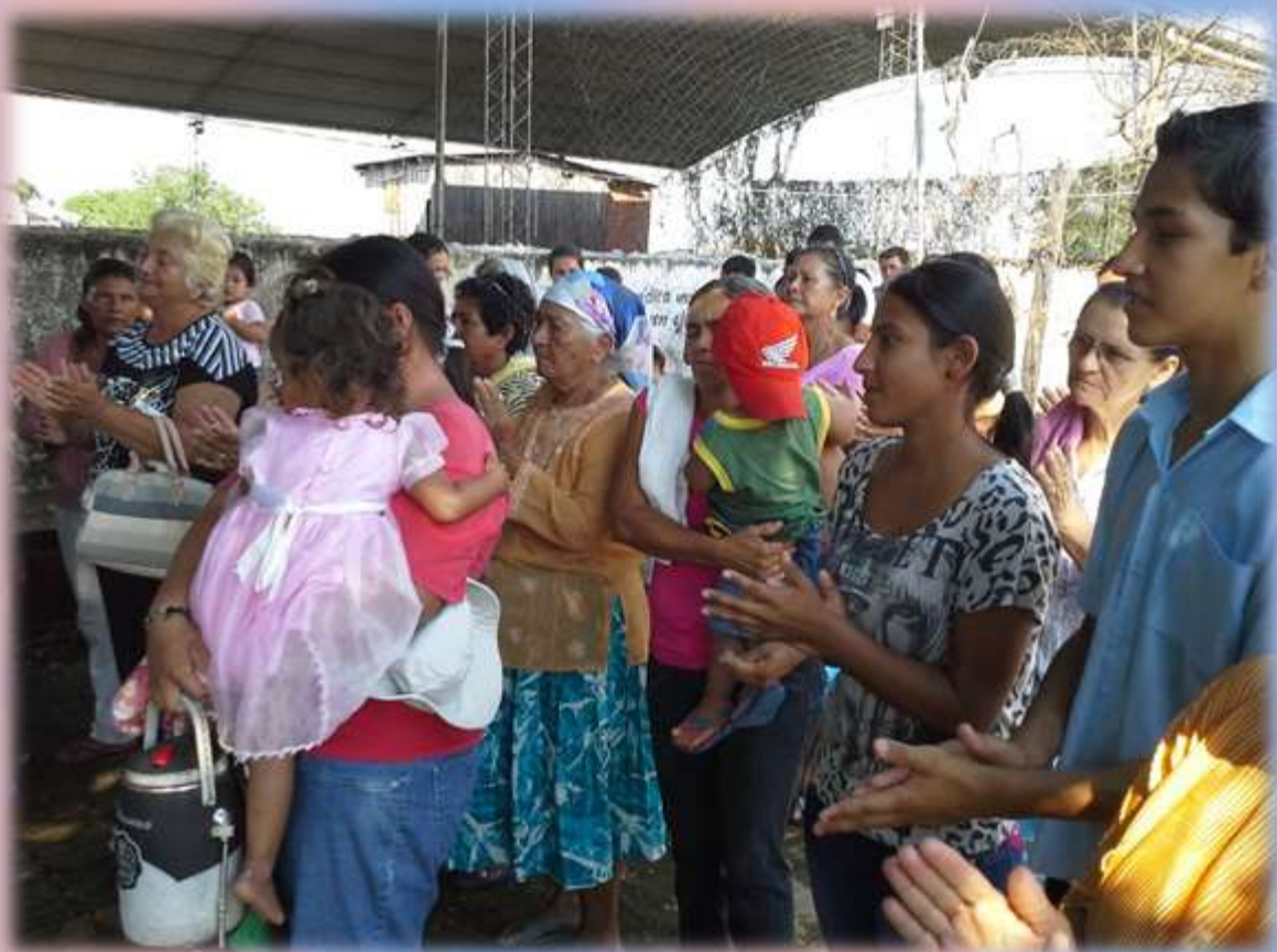
Participación de los fieles e invitados en la Fiesta Patronal de Isla Margarita. Jueves 16 de octubre.