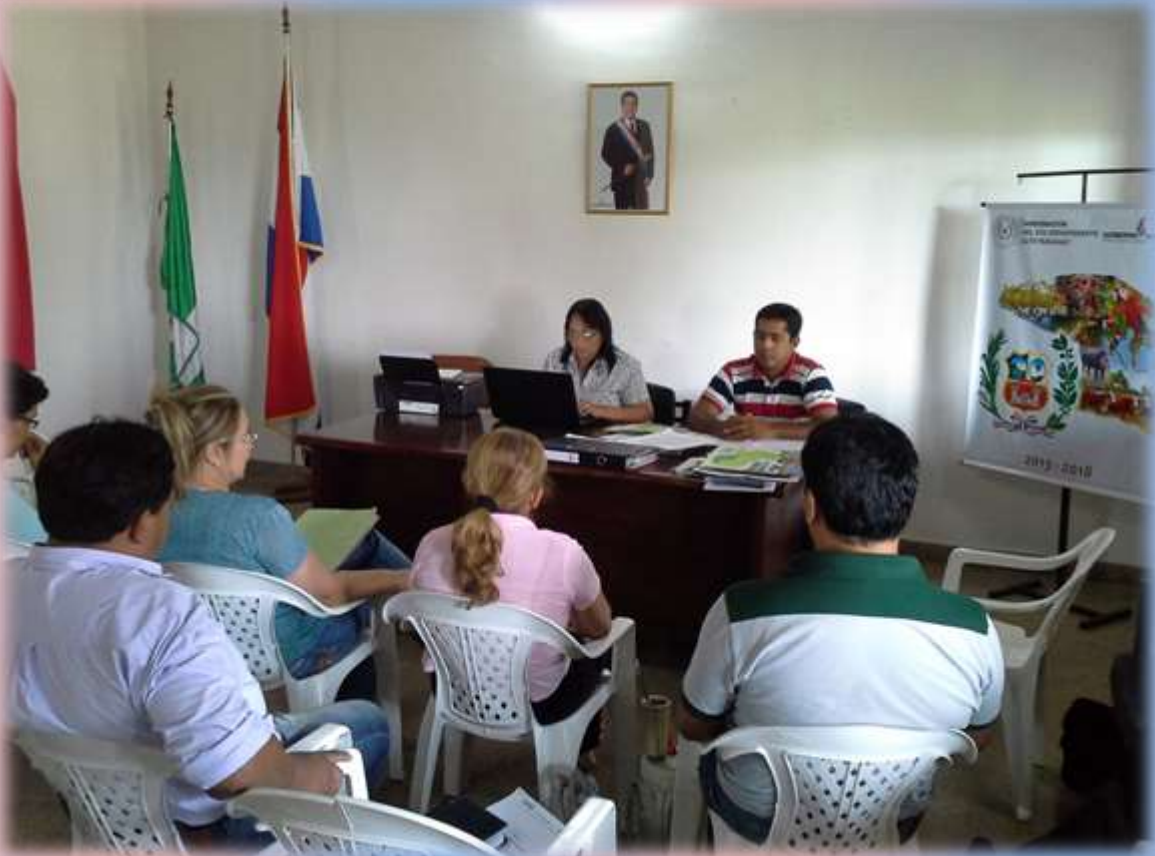
El viernes 24 de octubre en instalaciones de la Gobernación del Alto Paraguay, se reunieron los miembros de la Coordinadora Departamental de Educación para tratar temas relacionadas a dicho sector en beneficio del departamento.