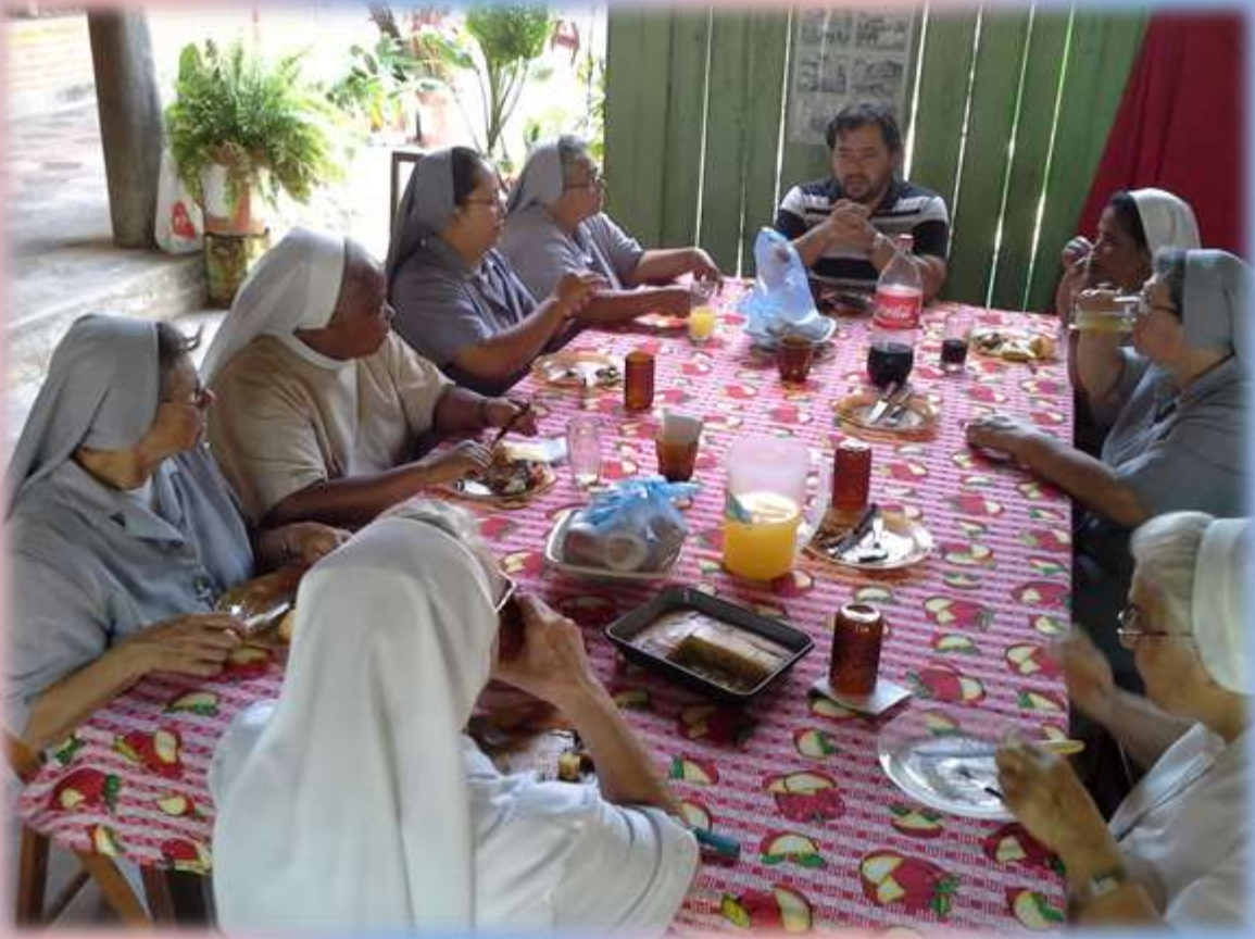
El compartir Fraternal en la mesa. Asamblea del VACH. Puerto Casado.