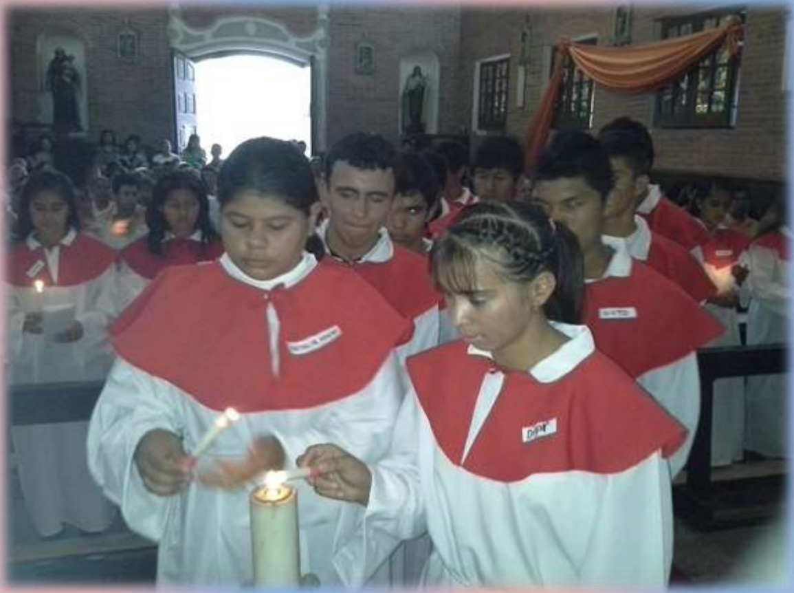
Momentos de la renovación de las promesas bautismales por parte de los jóvenes de la Parroquia San Ramón Nonato antes de recibir el SACRAMENTO DE CONFIRMACIÓN .