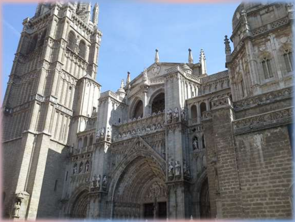
Imponente Iglesia Catedral de Toledo, España.