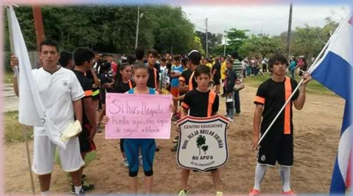
Alumnos de la Escuela Agrícola Mons. Alejo Obelar, Ñu Apua.