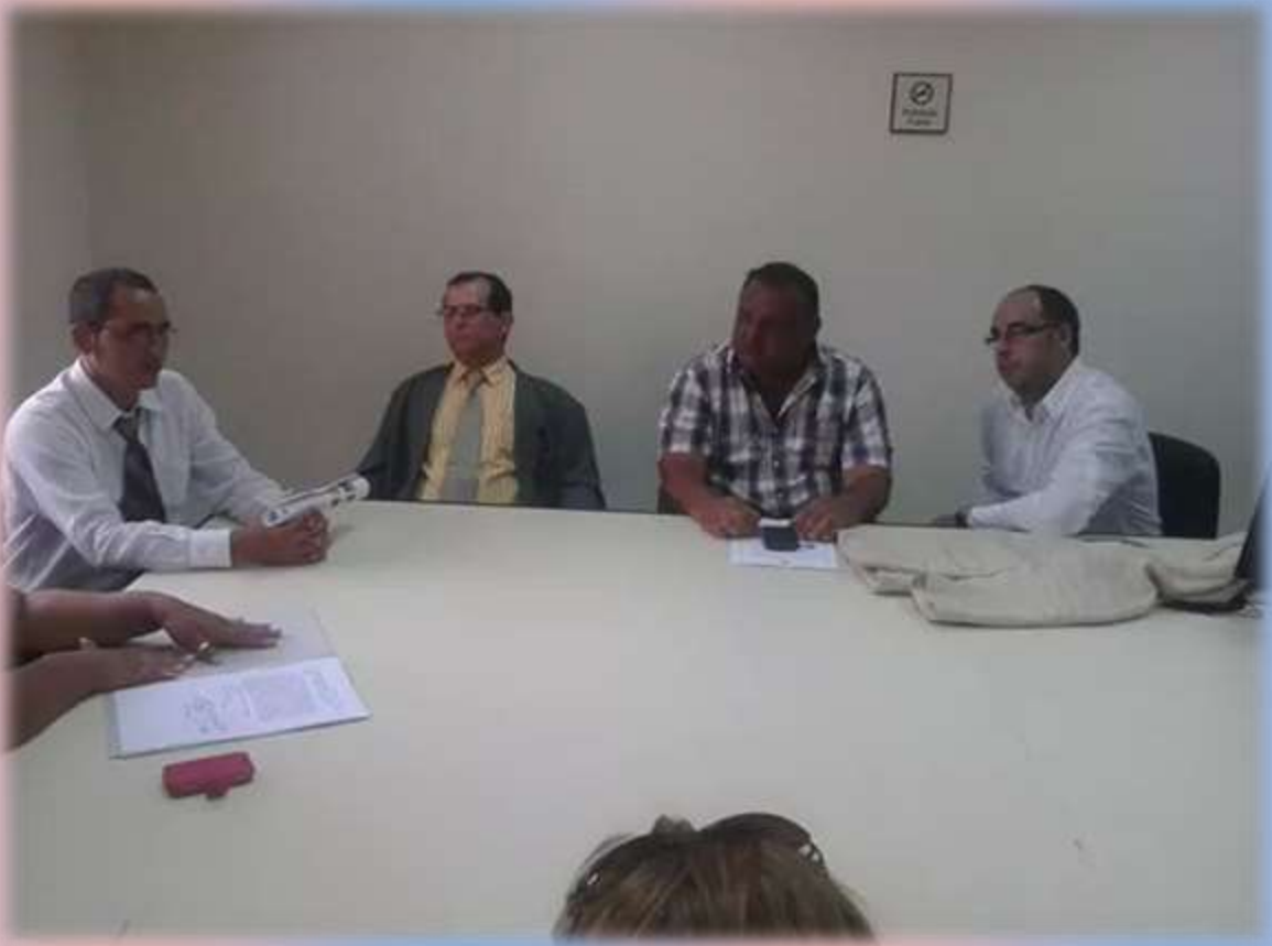
La comisión de Pro-tierra de Puerto Guaraní en fecha 17 de septiembre se reunió con las autoridades presentes para tratar algunas preocupaciones de los pobladores.