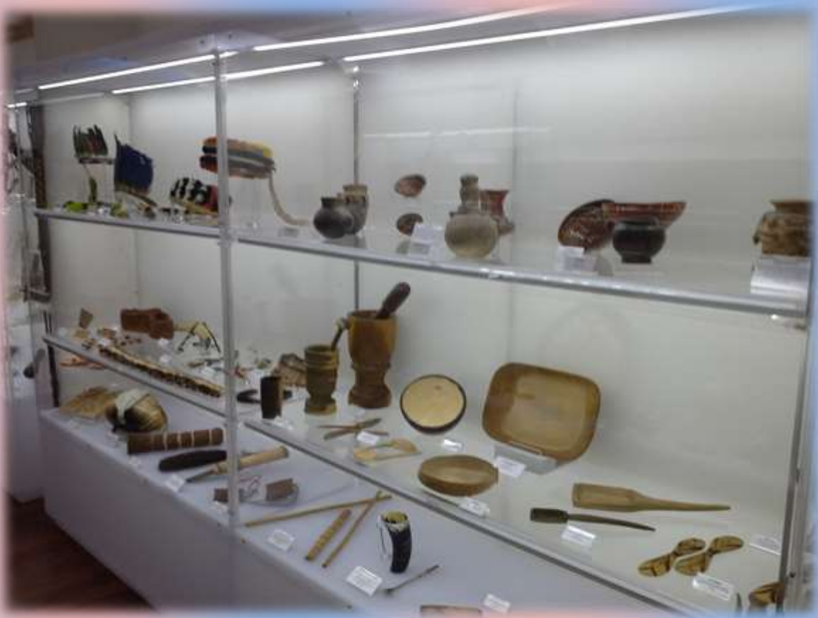
Museo Misionero de la Procura Salesiana de Madrid.