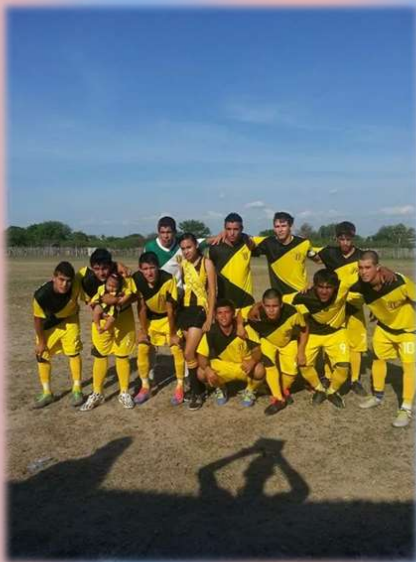
Equipo de Fútbol de Puerto Guaraní con su respectiva Reina.