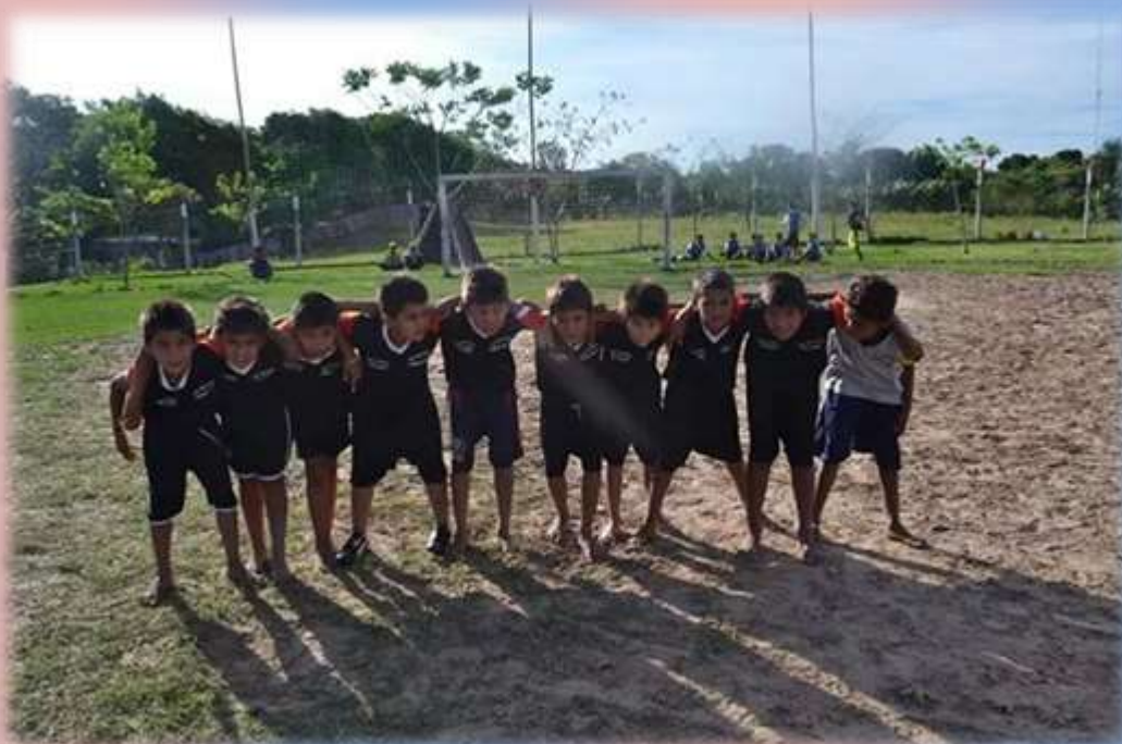
Momentos de mucha alegría se han vivido en esos días.