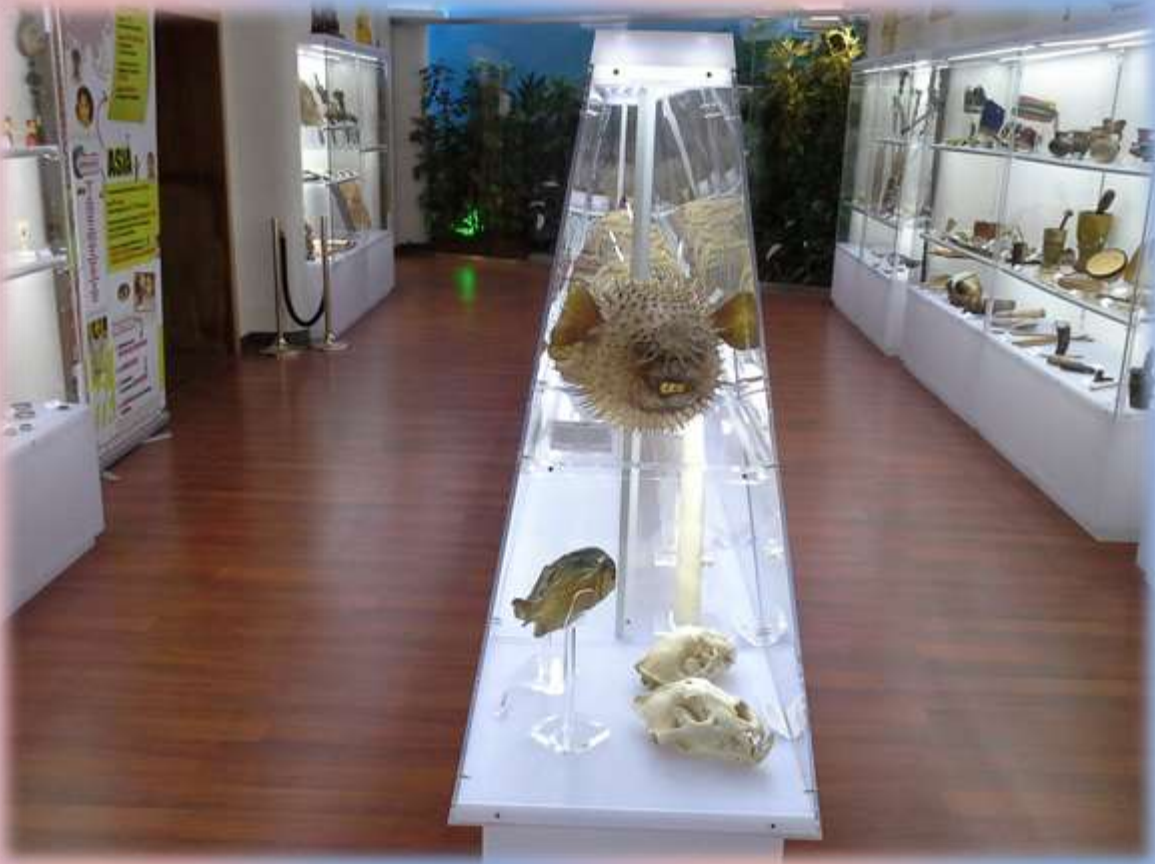
Museo de la Procura Misionera Salesiana de Madrid.