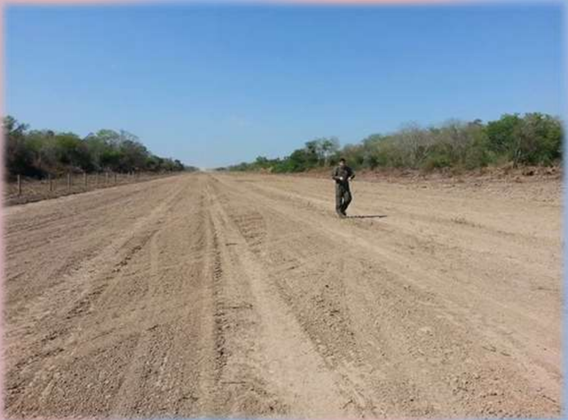
Pista de aterrizaje de Toro Pampa terminada.

La comisión vecinal presentó al Comando de la Aeronáutica el deseo de poder contar con vuelos a la localidad de Toro Pampa con la construcción de una pista de aterrizaje.