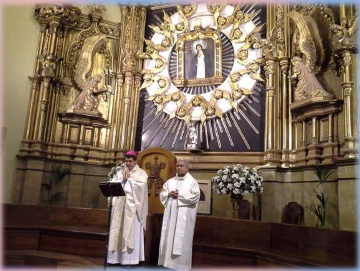
El martes 30 de septiembre, Mons. Gabriel Escobar, preside la Misa para los migrantes paraguayos en Madrid esta vez en la Parroquia de la Paloma , atendido por los sacerdotes del Neocatecumenado.