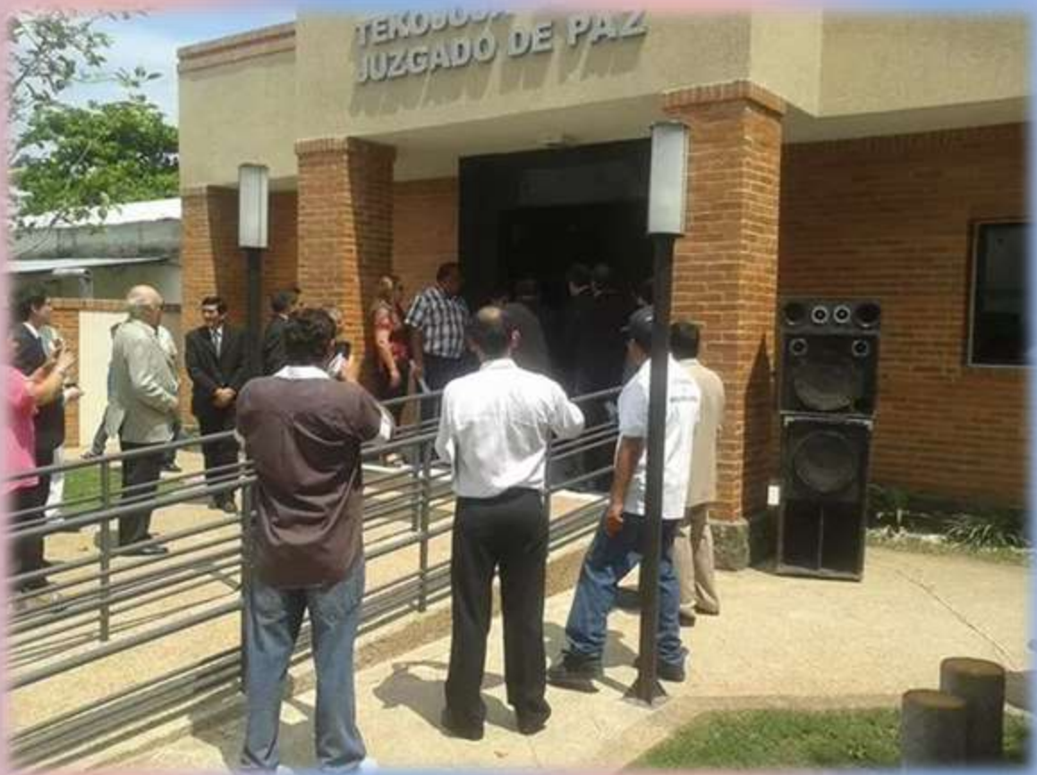
Fachada del Juzgado de Paz de Pto. Guaraní.