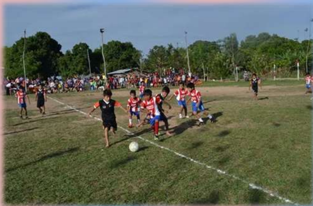
Equipos participantes del torneo Sub 10 en Carmelo Peralta.