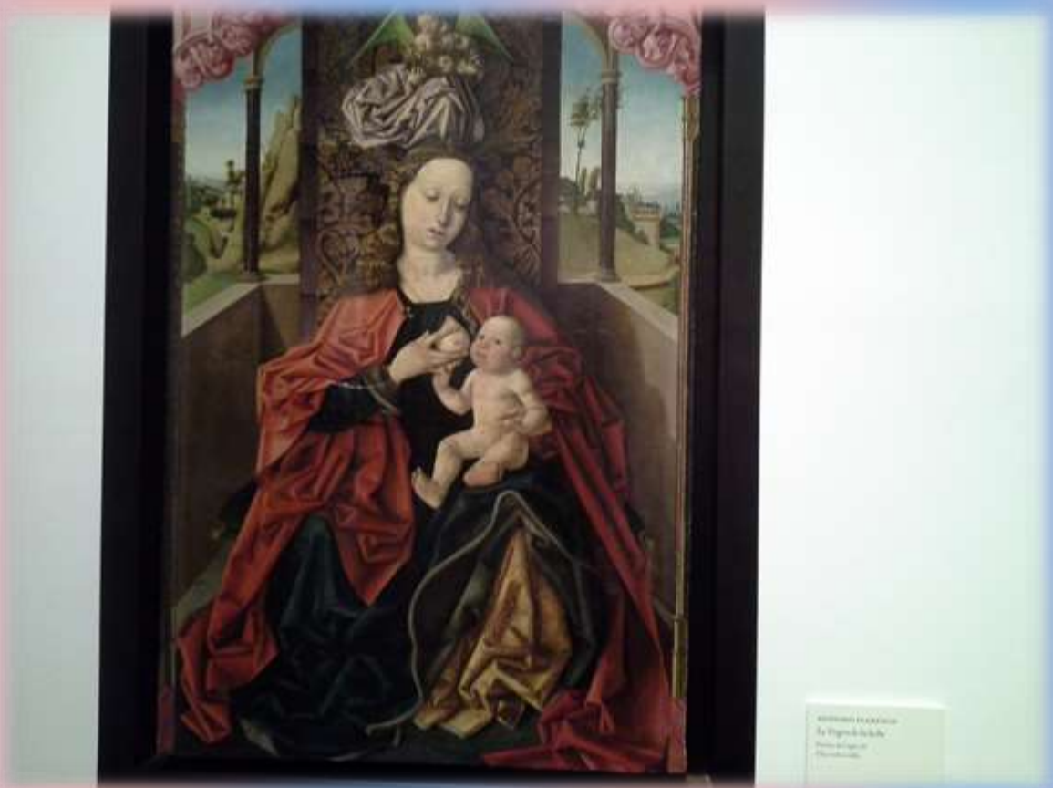
Uno de los hermosos cuadros que se encuentra en los Museos de la Iglesia Catedral este fresco dedicada a LA VIRGEN DE LA LECHE en Toledo, España.