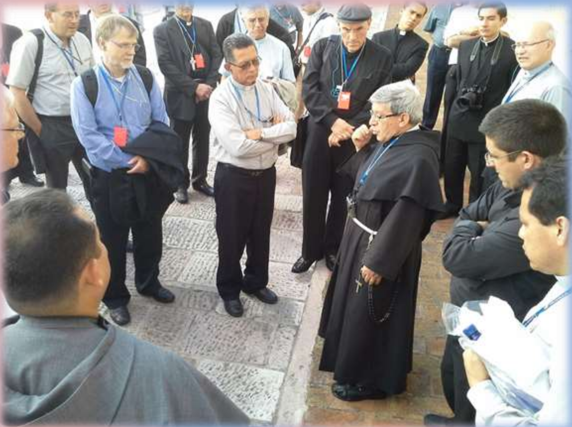
Momentos maravillosos de la Peregrinación a Asís.