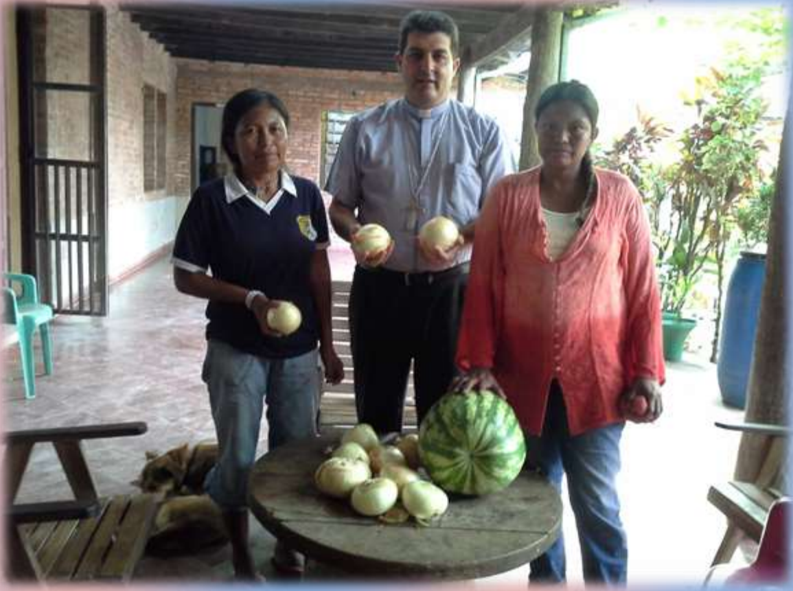
Miembros de la comunidad de los Maskoy del Pueblito de la misión de Puerto Casado hicieron entrega al Obispo de los productos cultivados por ellos como regalo.