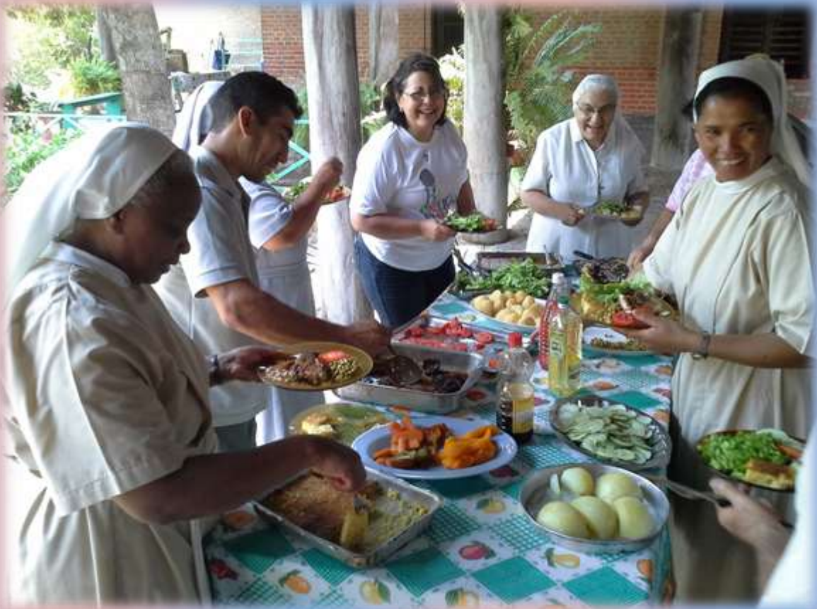
Compartiendo el almuerzo alrededor de la mesa en la última Asamblea de los misioneros en Puerto Casado.