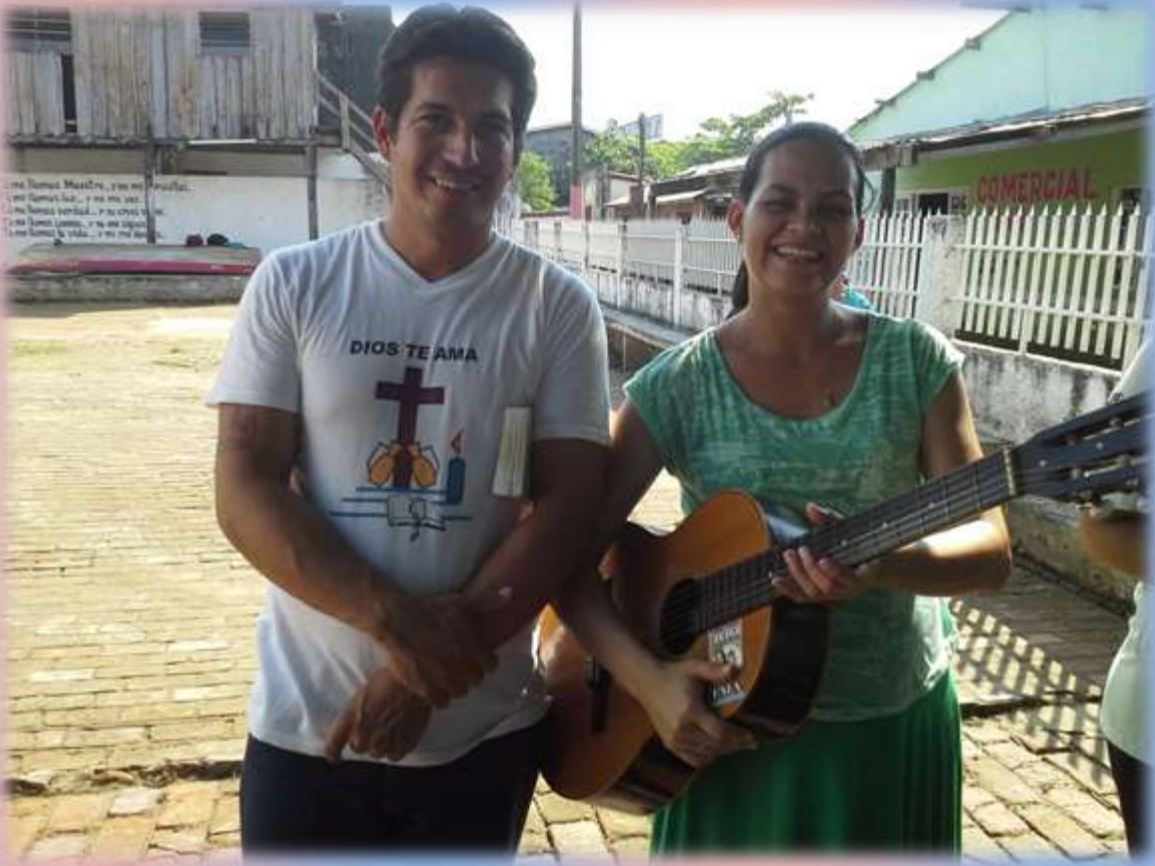
Nuestros grandes catequistas de la Vicaría Santa Margarita María en Isla y miembros de la Familia Misionera.