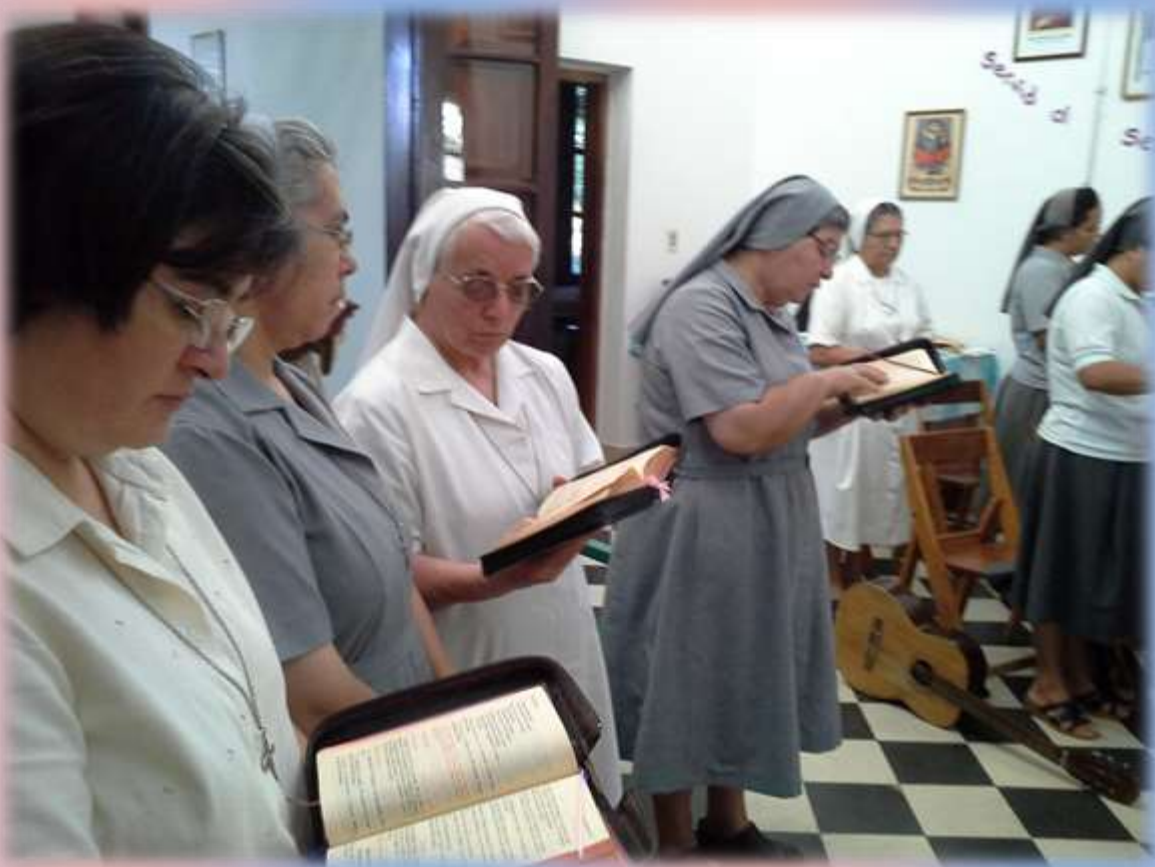
Momento de oración y práctica de piedad de los misioneros en la última Asamblea Misionera del año.