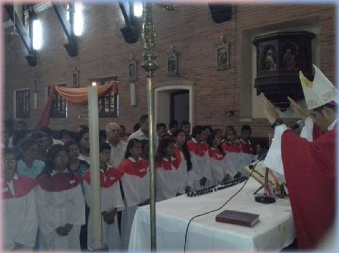
Imposición de Manos por parte del Obispo, invocando la presencia del Espíritu Santo en los nuevos confirmandos.