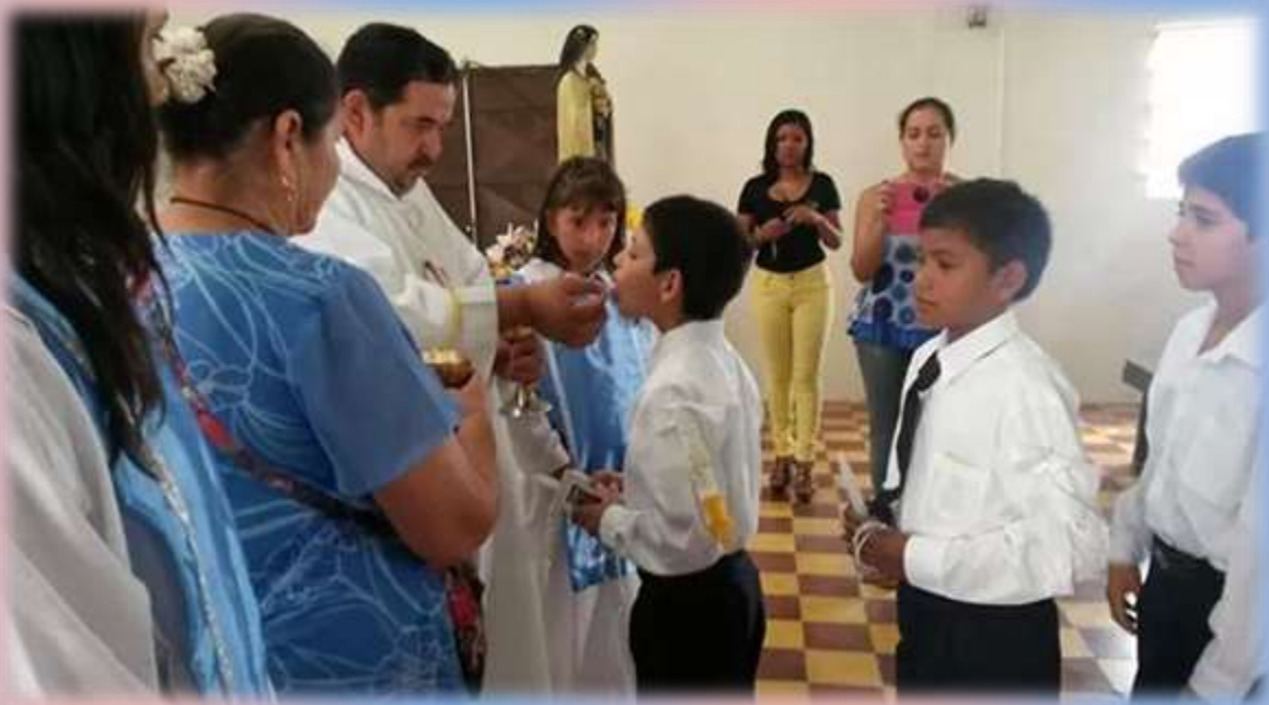
Varios niños/as se acercaron al SACRAMENTO DE LA PRIMERA COMUNIÓN .