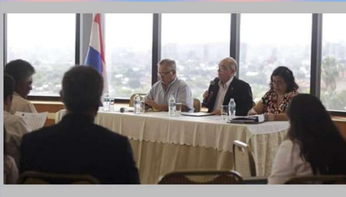
Congreso Nacional. Audiencia Pública sobre “Territorio y Presupuesto Público”.

Con el objetivo de considerar el Presupuesto General de la Nación para el 2015 y la importancia de prever los recursos necesarios para mejorar la calidad de vida de las comunidades y pueblos indígenas, que cuentan con tierras propias tituladas y para la compra de tierras a favor de comunidades y pueblos todavía desposeídos, los senadores de las Bancadas de Avanza País y Frente Guasu debatieron en una Audiencia Pública que se desarrolló en el Senado.