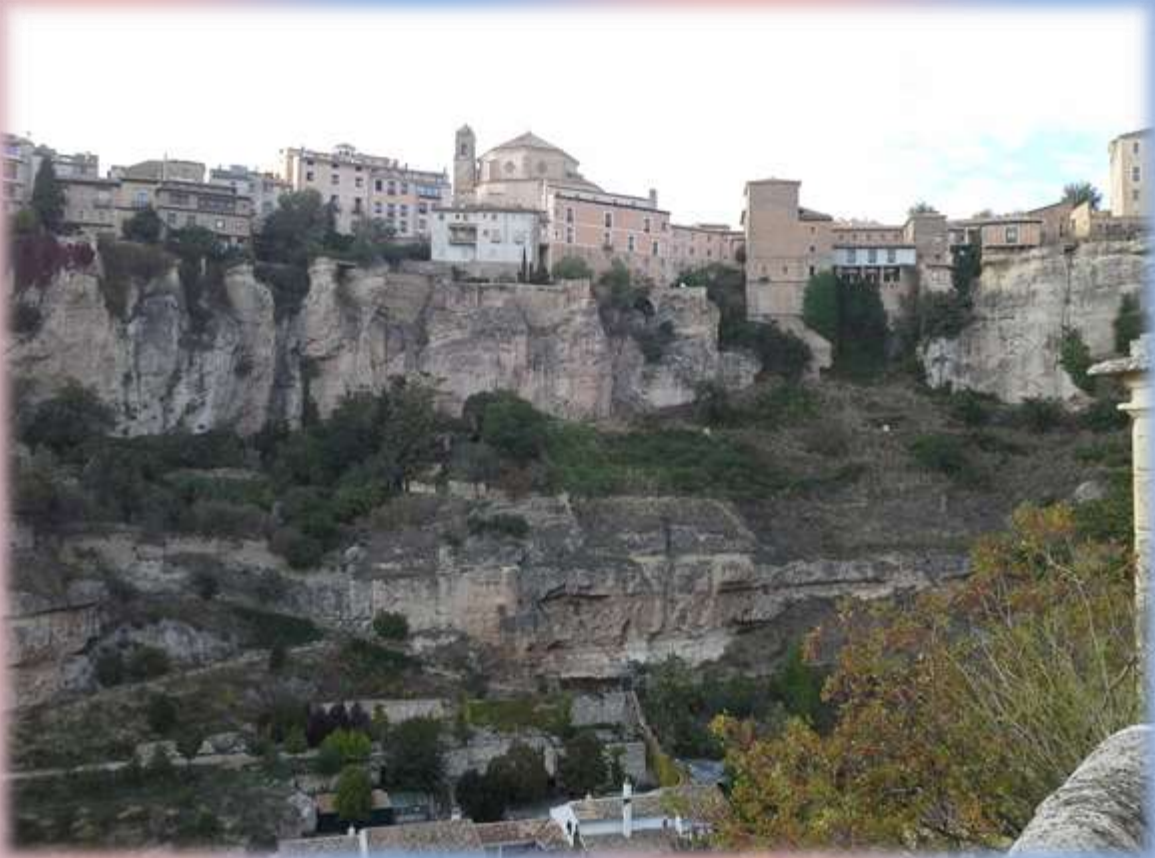
Visitando la hermosa Cuenca, España.