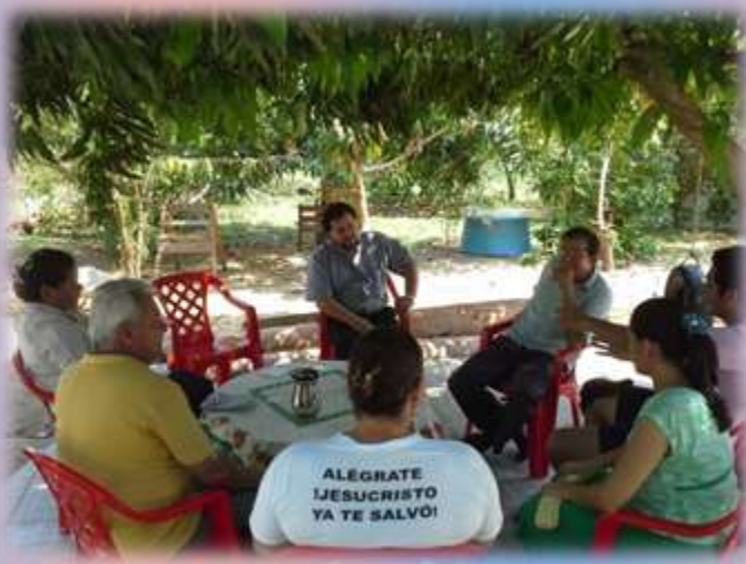
Compartir fraterno con los coordinadores de la Capilla Santa Margarita María de Isla Margarita en el Rancho KUNUU.