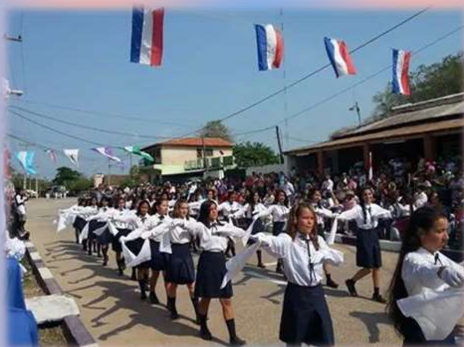
Los abanderados no estuvieron ausentes para homenajear el aniversario de Forte Olimpo.