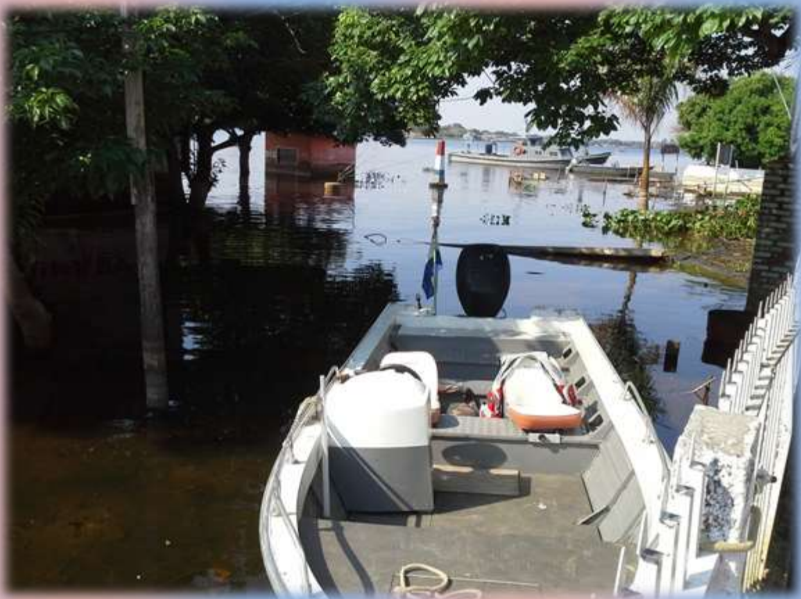
Lentamente van bajando las aguas del río Paraguay en esta Isla que fue inundada. A pesar ello no fue motivo de suspender la fiesta con el pueblo.