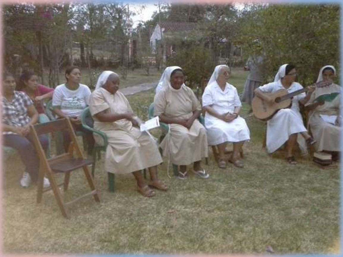
La Eucaristía centro y motor de nuestra entrega por el servicio del Reino de Dios en las tierras de misión.