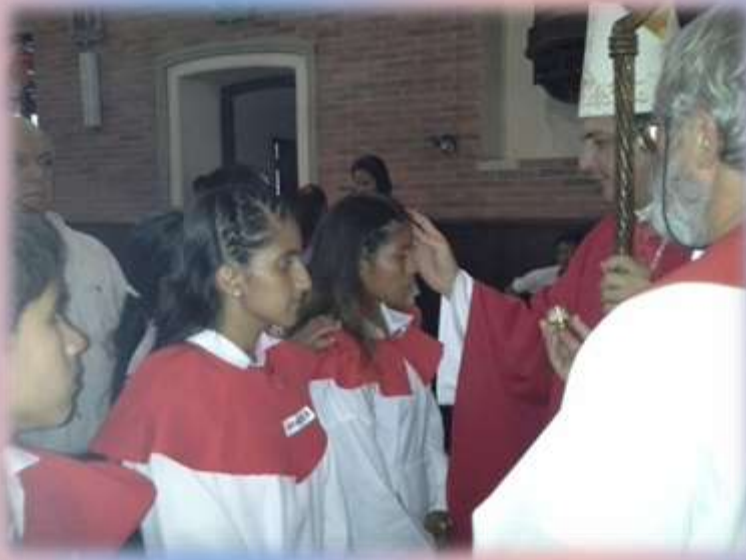
También varios indígenas del Pueblo Maskoy también recibieron el SACRAMENTO DE LA CONFIRMACIÓN .