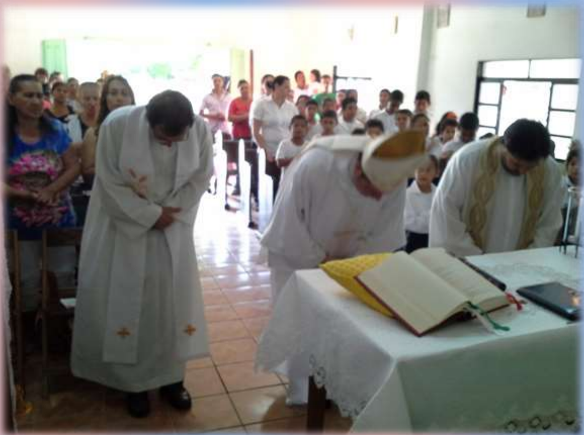
Inicio de la Santa Misa en Isla Margarita en Homenaje a su Santa Patrona a Margarita María, que se realizó el 18 de octubre.