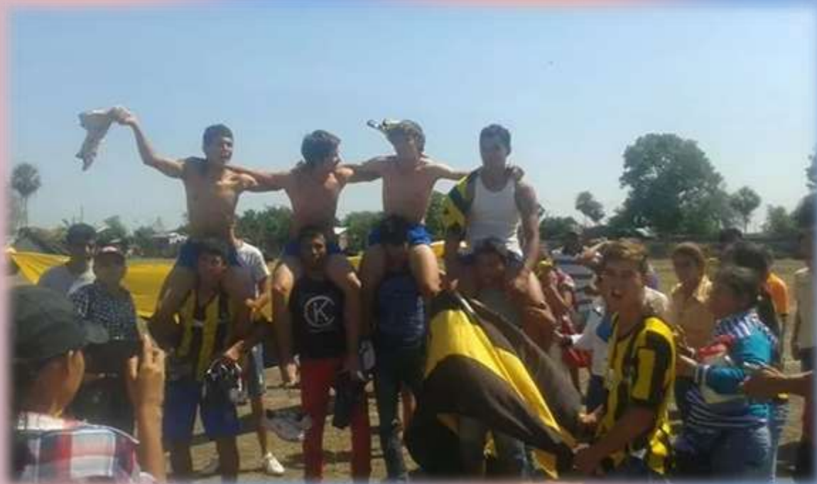
Hinchada y jugadores de Puerto Guaraní.