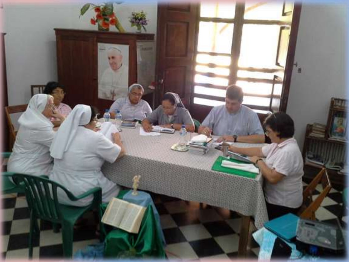
Trabajo Grupal. Zona Norte.