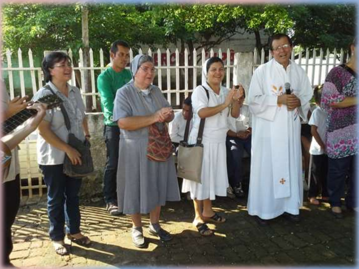
Religiosos/as que atienden espiritualmente dicha comunidad cristiana.