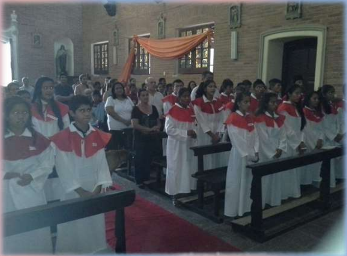
Varios jóvenes de Puerto Casado se acercaron al SACRAMENTO DE LA CONFIRMACIÓN .