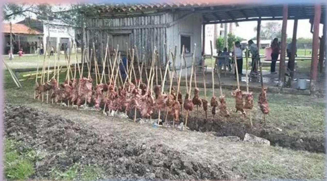
Almuerzo ofrecido a toda la población, el asado a la estaca.