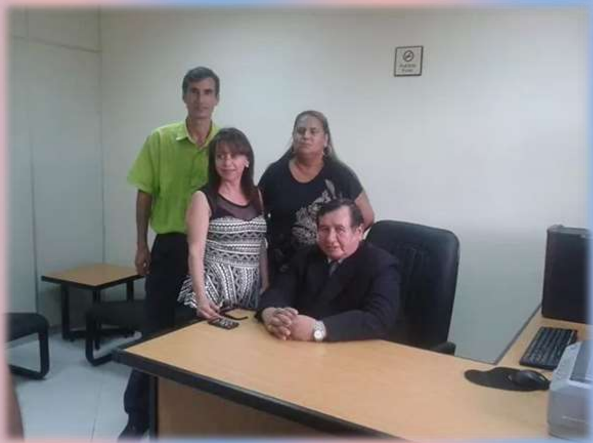
El Juez de Paz junto con los miembros de las fuerzas vivas de la comunidad.