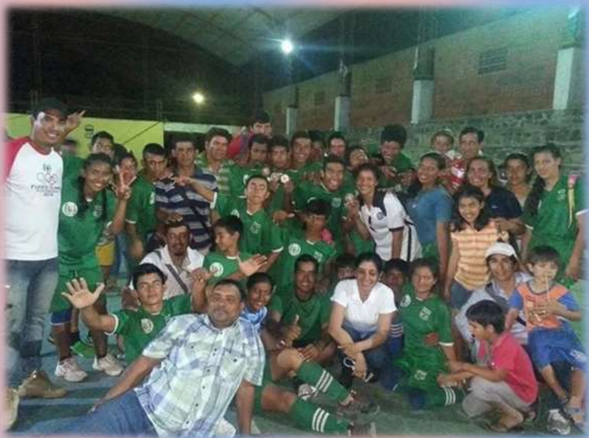
Delegación del Colegio Nacional del Distrito de Carmelo Peralta.