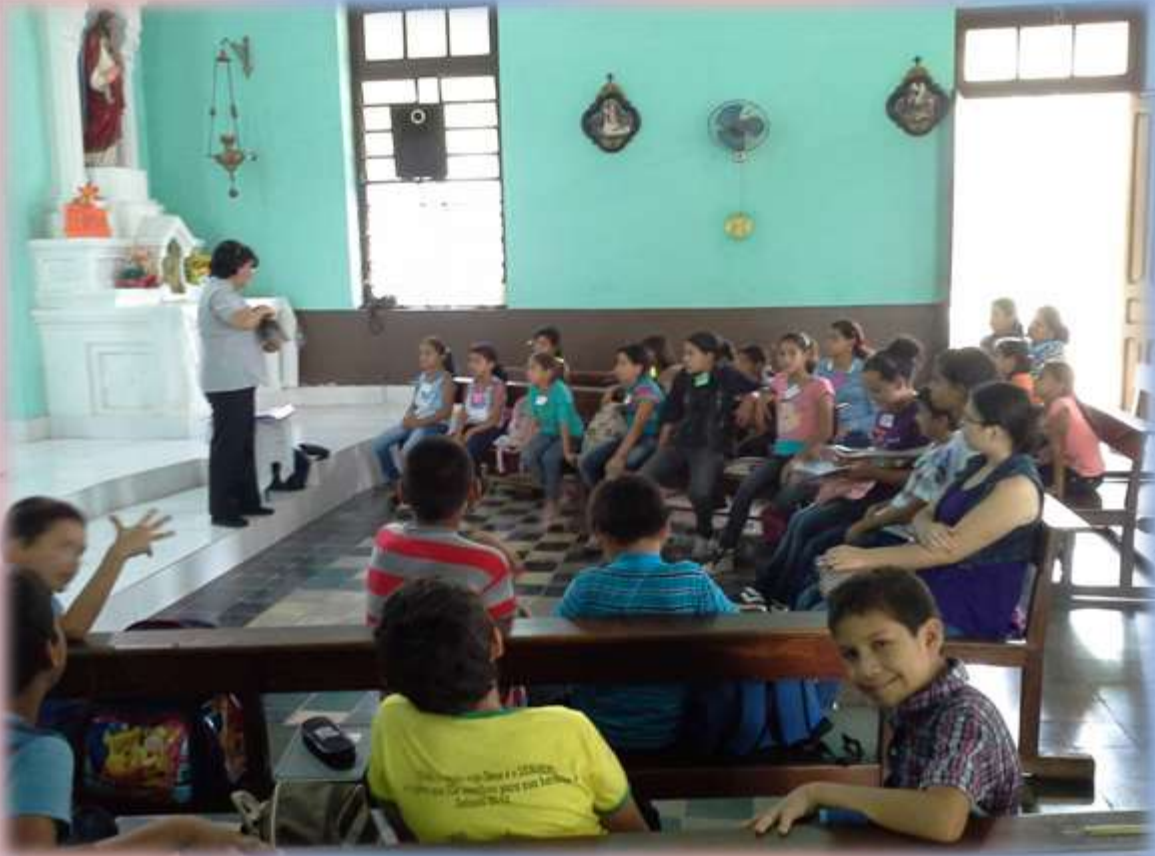
Encuentro de niños/as del primer año de la capilla San Miguel de Forte Olimpo.