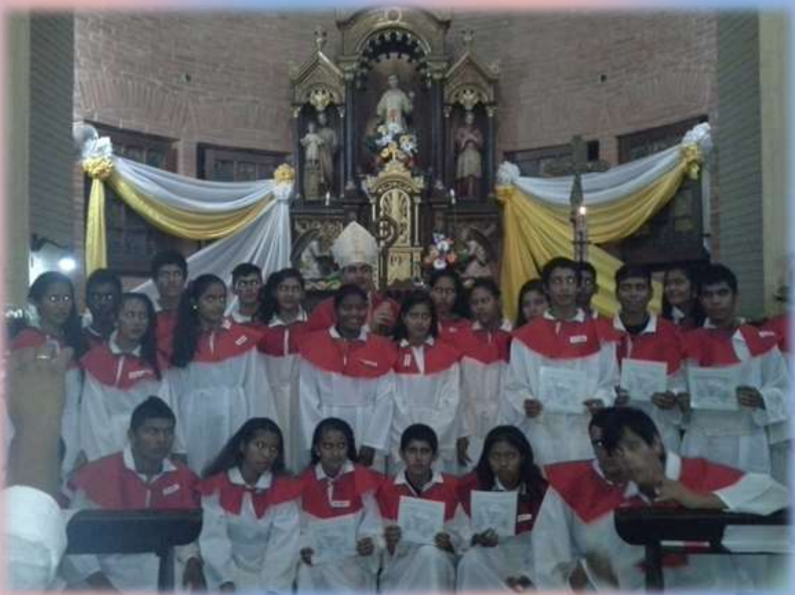
Foto recuerdo de los jóvenes recién confirmados de Puerto Casado con el Sr. Obispo.