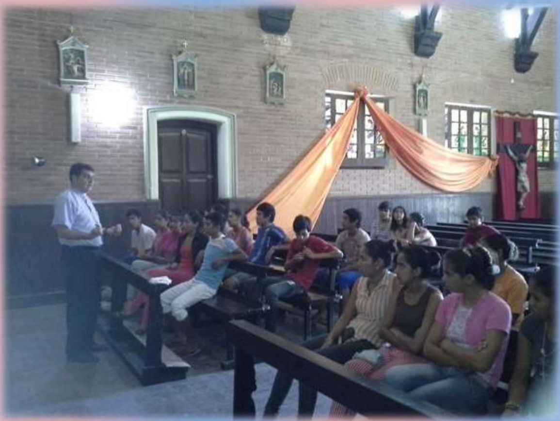
En el Templo de la Parroquia San Ramón Nonato el Sr. Obispo Gabriel Escobar tuvo un momento de formación y encuentro con los jóvenes que recibirán el SACRAMENTO DE LA CONFIRMACIÓN