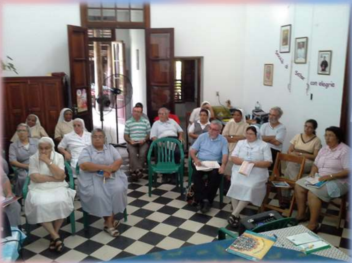
Momento de la Plenaria en la Asamblea del VACH. Puerto Casado.