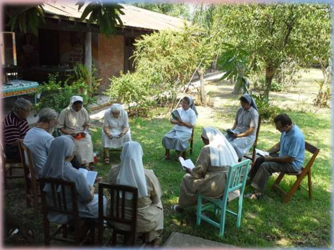
Momento de trabajo en grupos. Zona Sur.