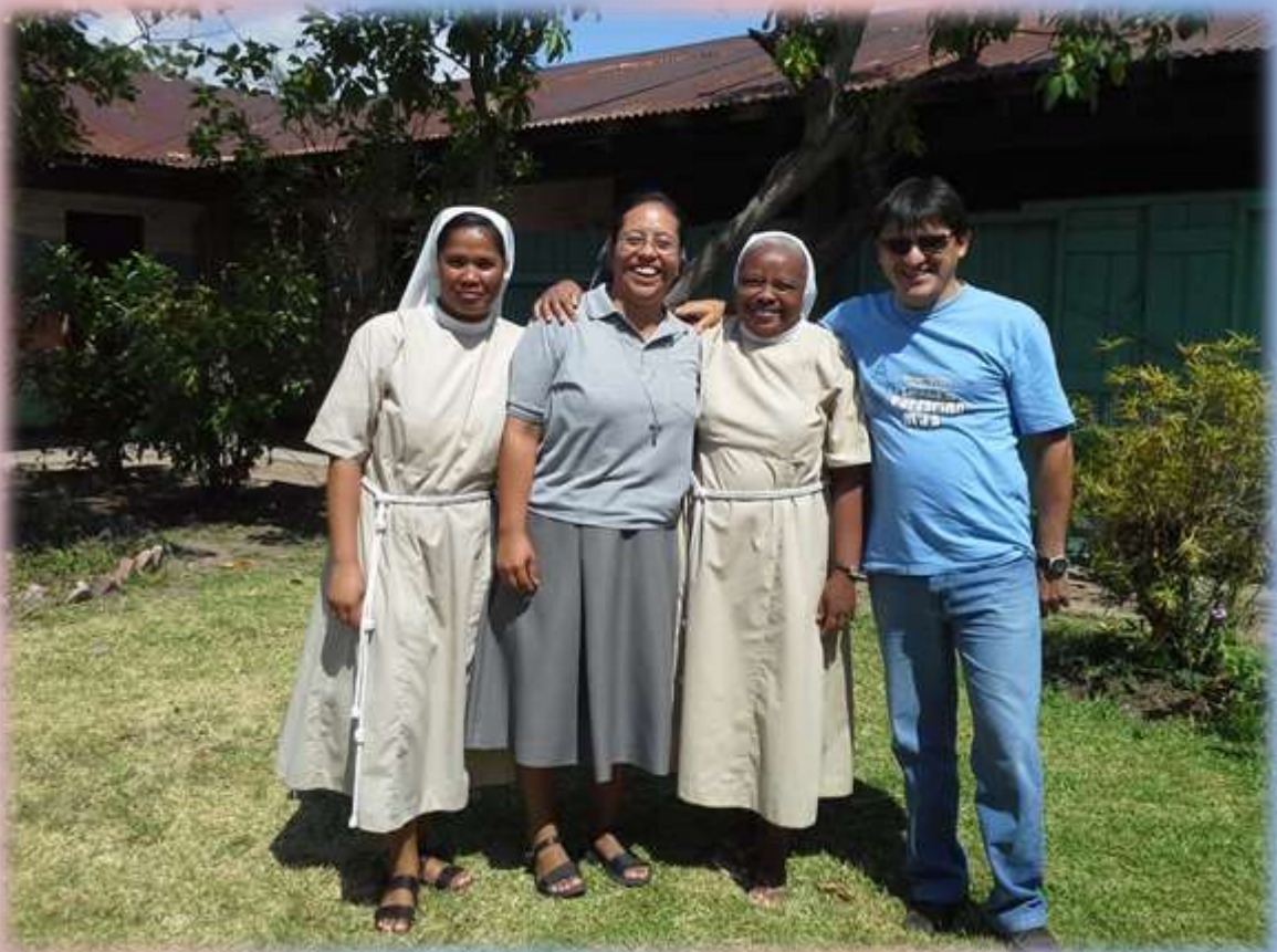
Momentos de Fraternidad y alegría...