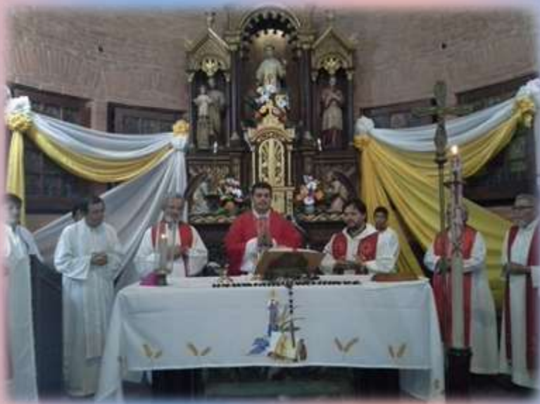
Momento de la Celebración del Sacramento de la Confirmación en Puerto Casado.