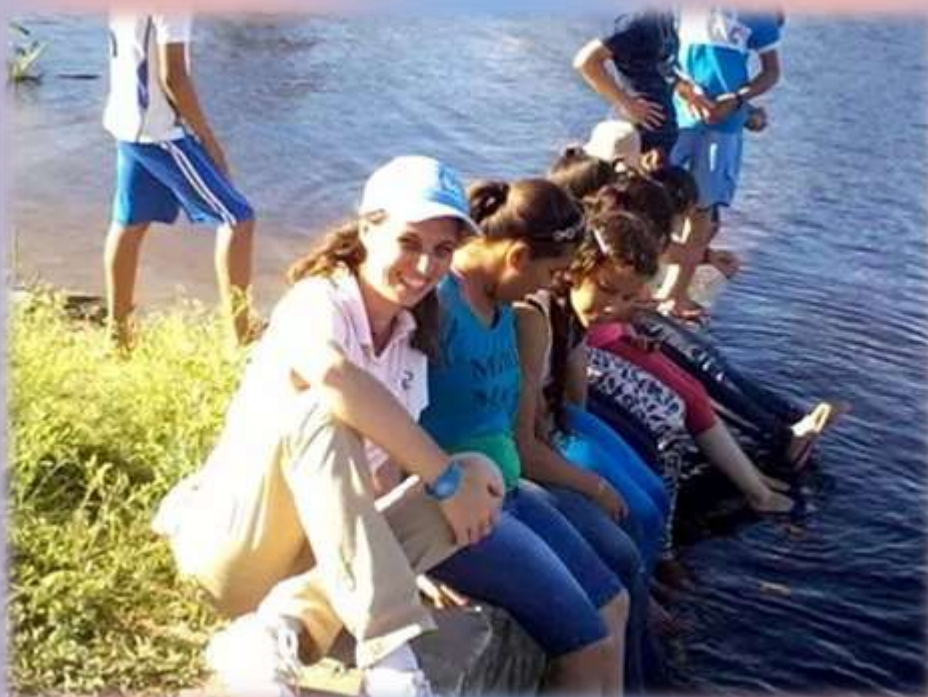
Momentos de refrescarse a orillas del río Paraguay para aplacar el intenso calor de esos días.