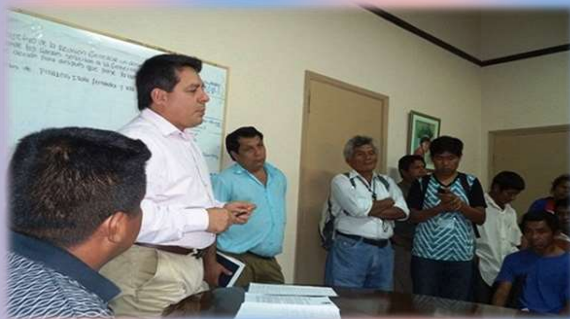
Representantes de MAIPy presentaron sus demandas al titular del INDI.

La Mesa de Articulación Indígena del Paraguay (MAIPy), integrante de la Coordinadora de Organizaciones Campesinas e Indígenas del Paraguay COCIP, al recordarse un año más del descubrimiento de América, dio a conocer un manifiesto a la opinión pública nacional e internacional donde significan que siguen sufriendo las mismas agresiones desde hace más de 500 años.