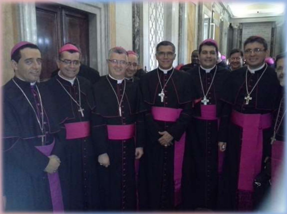
Obispos Latinoamericanos que participaron al Seminario para nuevos Obispos, antes de la audiencia con el Santo Padre el Papa Francisco en el Vaticano