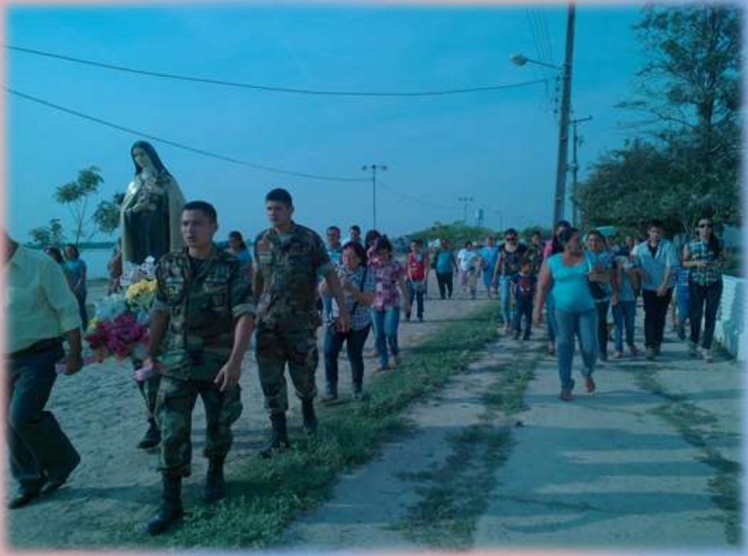
También las Fuerzas Militares Naval de Bahía Negra se hicieron presenta para tal festejo a su Santa Patrona Santa Teresita del Niño Jesús.