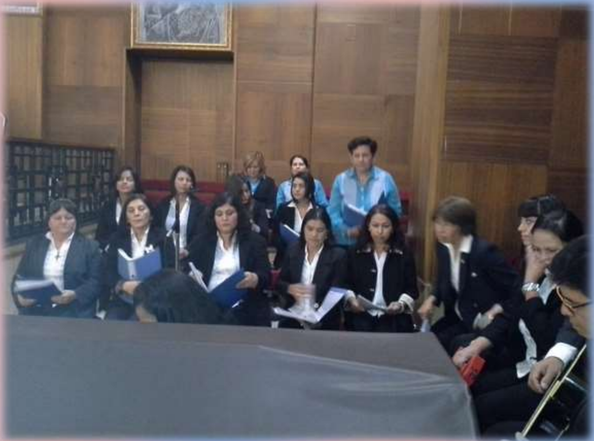
Coro de la Parroquia Santa Micaela , conformado por la mayoría de paraguayos, donde animan cada domingo la Santa Eucaristía.