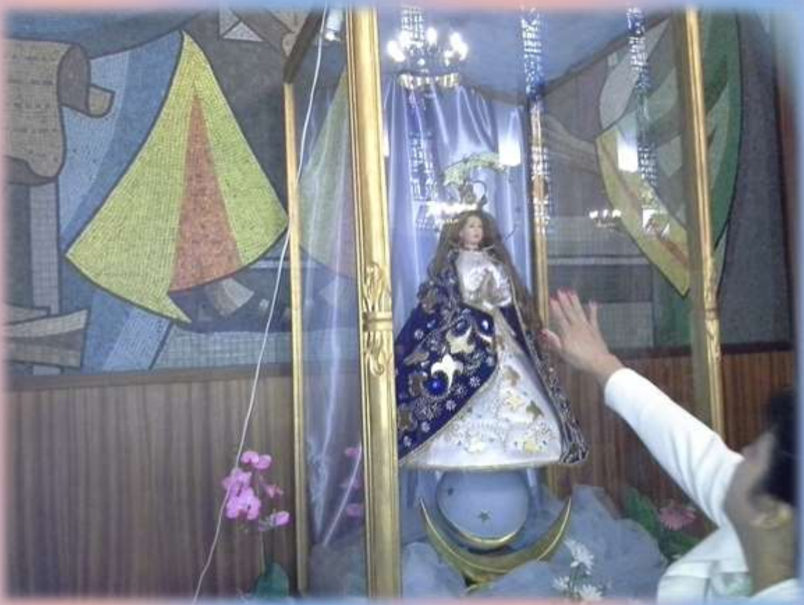
Hermosa imagen réplica de la Virgencita de los Milagros de Caacupé en unos de los altares menores en la Iglesia Parroquial Santa Micaela en Madrid .