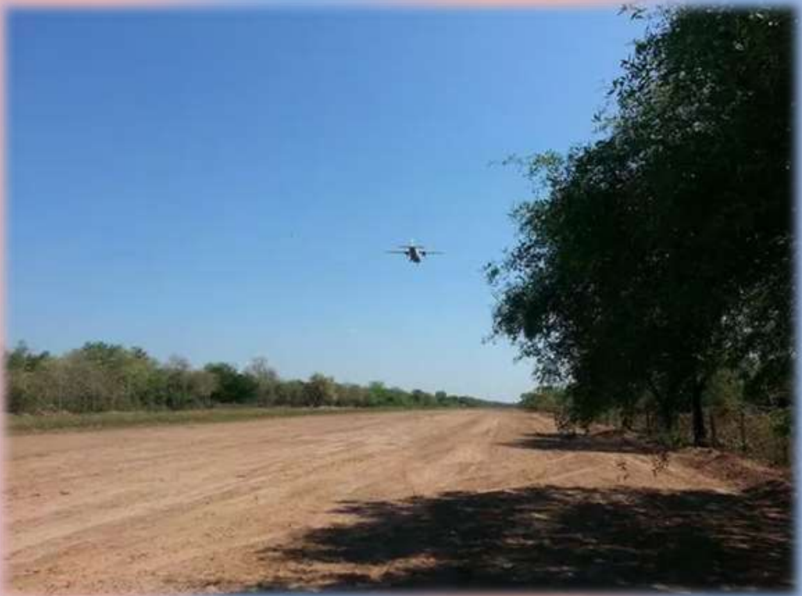
Avión despegando de la pista de Toro Pampa.