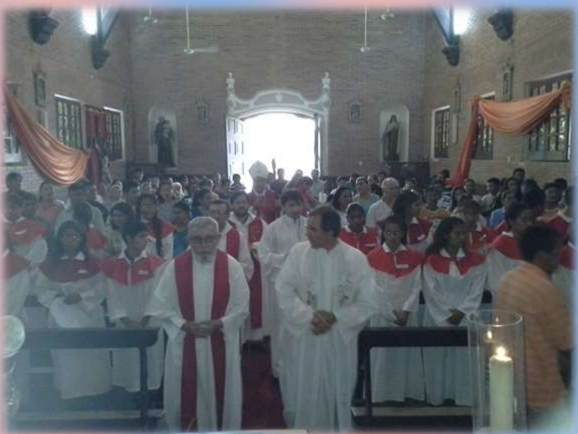
El sábado 18 de octubre en la Parroquia San Ramón Nonato de Puerto Casado un buen grupo de jóvenes se acercaron para recibir el SACRAMENTO DE LA CONFIRMACIÓN , presidido por el Obispo del lugar.