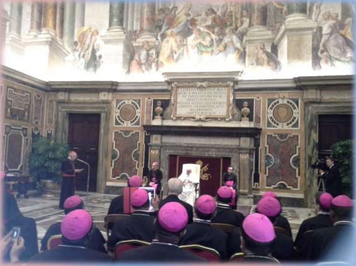
Sábado 20 de septiembre 11:00 h de Roma, audiencia del Santo Padre Francisco en la Sala Clementina con los nuevos Obispos nombrados estos últimos años.