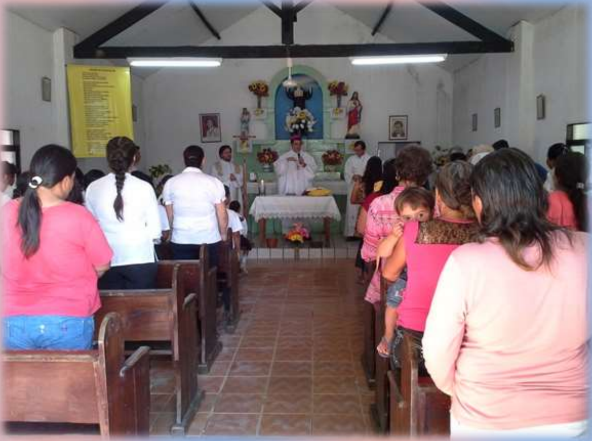
Misa en la Fiesta Patronal de Isla Margarita.