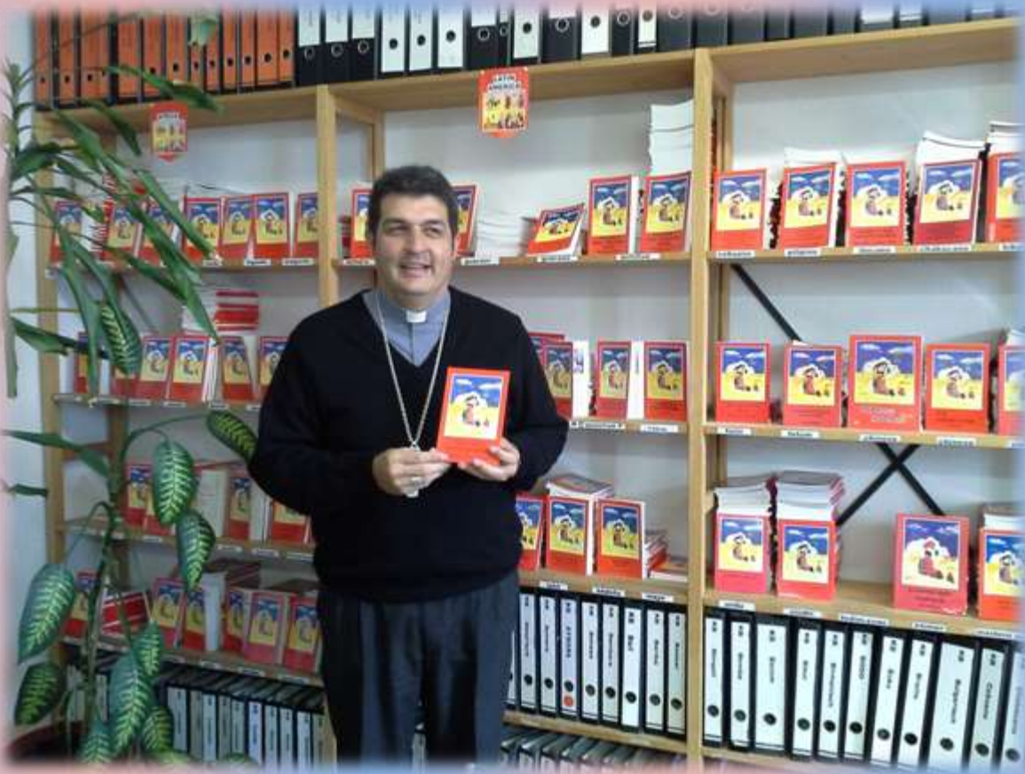
Mons. Gabriel en Kirche in Not en Alemania, donde se difunde la BIBLIA DE LOS NIÑOS , en distintos idiomas donde inclusive ya están en Guaraní, Nivache y Guarayo.....próximo en Ayoreo.