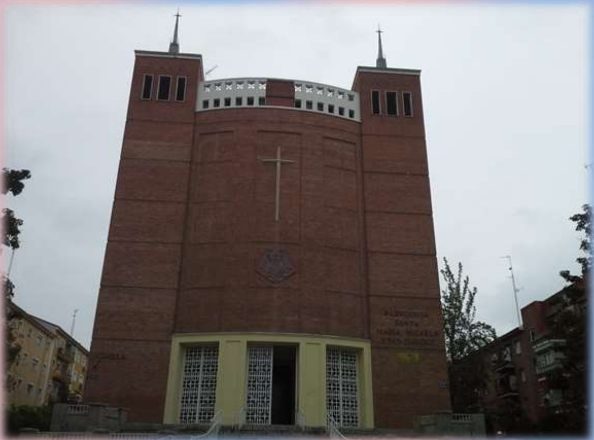
Iglesia Santa Micaela en Madrid, donde una buena cantidad de paraguayos trabajan por su Iglesia y donde le tienen entronizada a la Virgen de Caacupé.