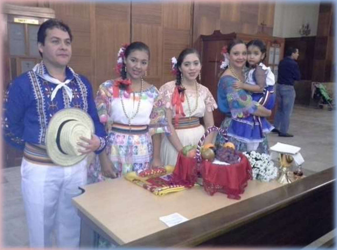
Compatriotas paraguayos preparando las ofrendas a ser presentados en la misa presidida por Mons. Gabriel Escobar a la colonia paraguaya en la Parroquia San Micaela de Madrid . Con trajes típicos del Paraguay.