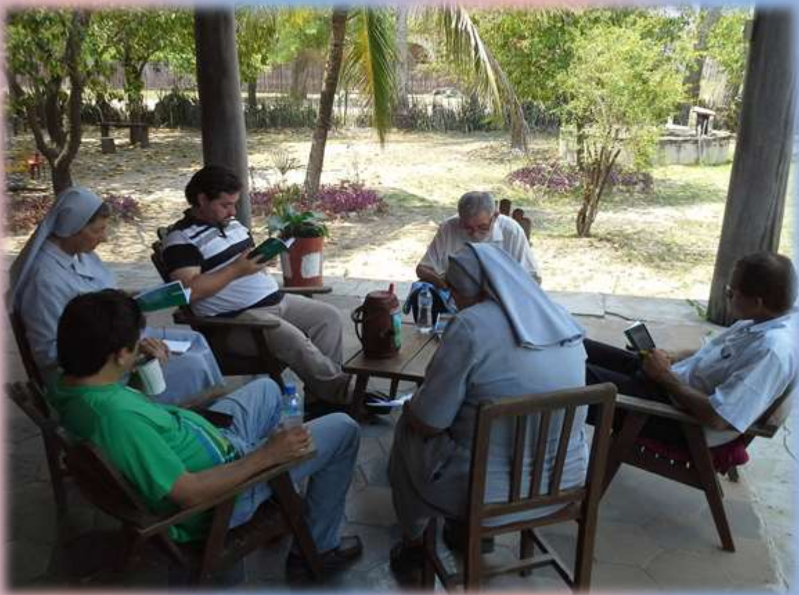
Momento de Trabajo de grupos. Zona Centro.