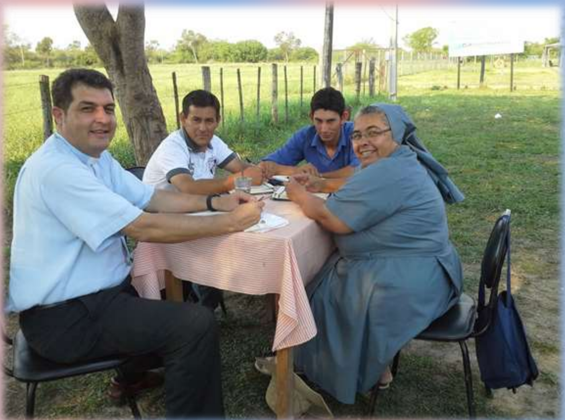
Martes 13 de septiembre: visita pastoral de Mons. Gabriel a la Escuela Agrícola de Ñuapua.