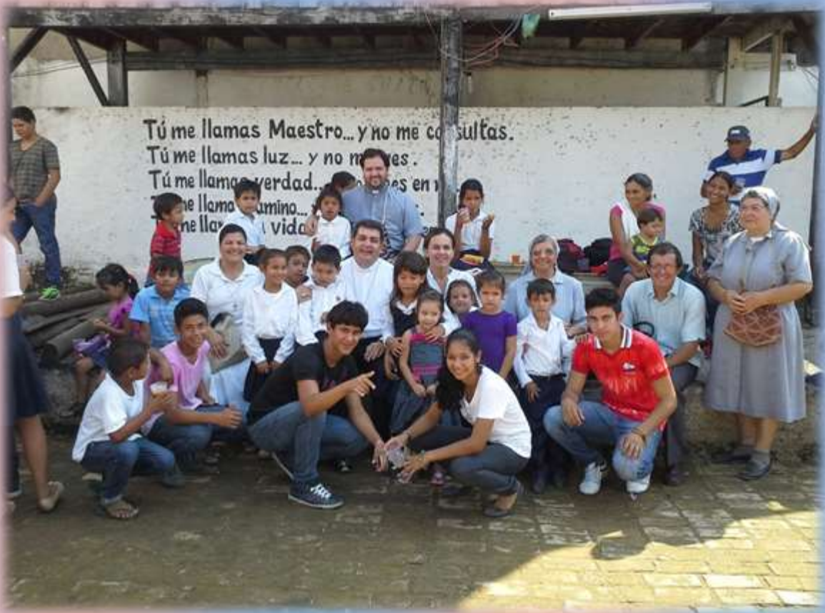
Los niños/as y jóvenes de la Isla con varios religiosos/as que trabajan en dicho lugar.