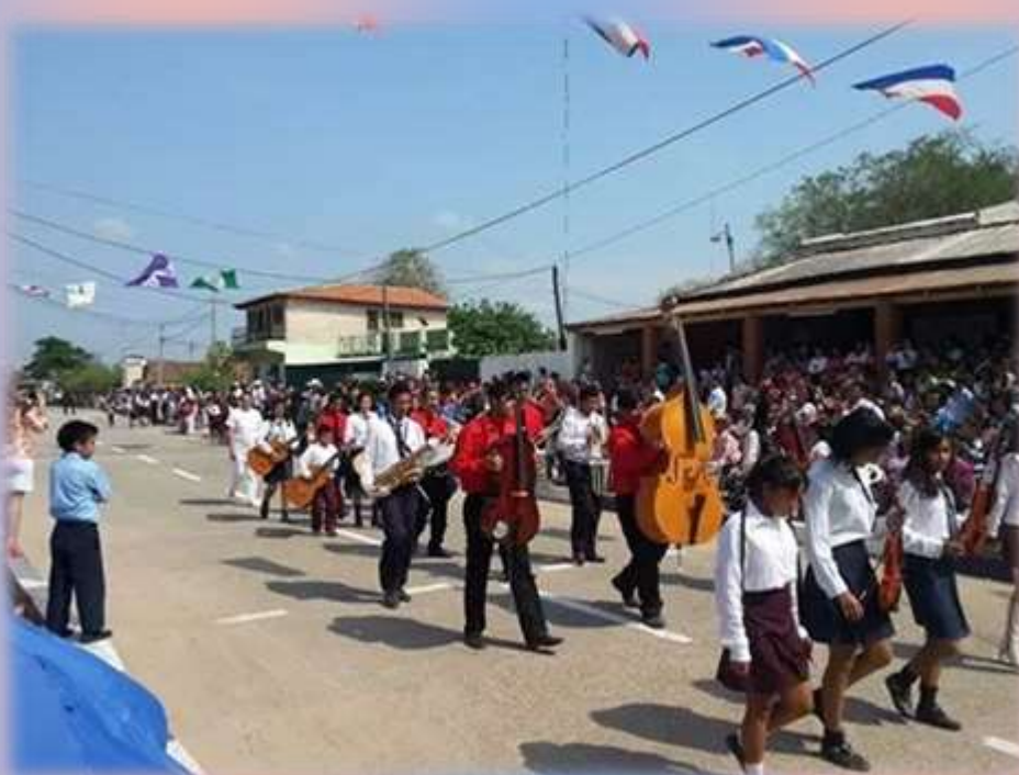
Desfile estudiantil y de varias instituciones de la Comunidad Olimpeña en homenaje a un Aniversario más de la Fundación del Pueblo de Forte Olimpo.