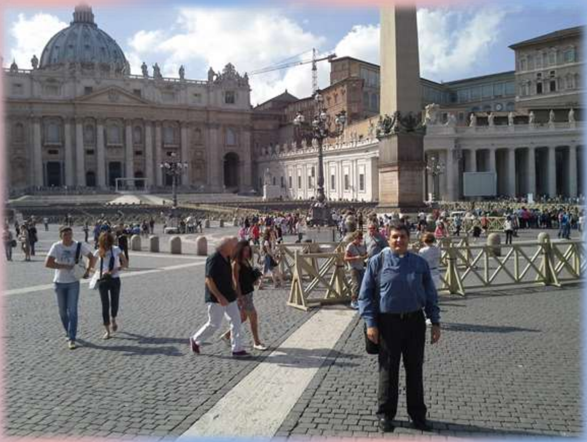
Visita del Mons. Gabriel Escobar a la Basílica de San Pedro en Roma.