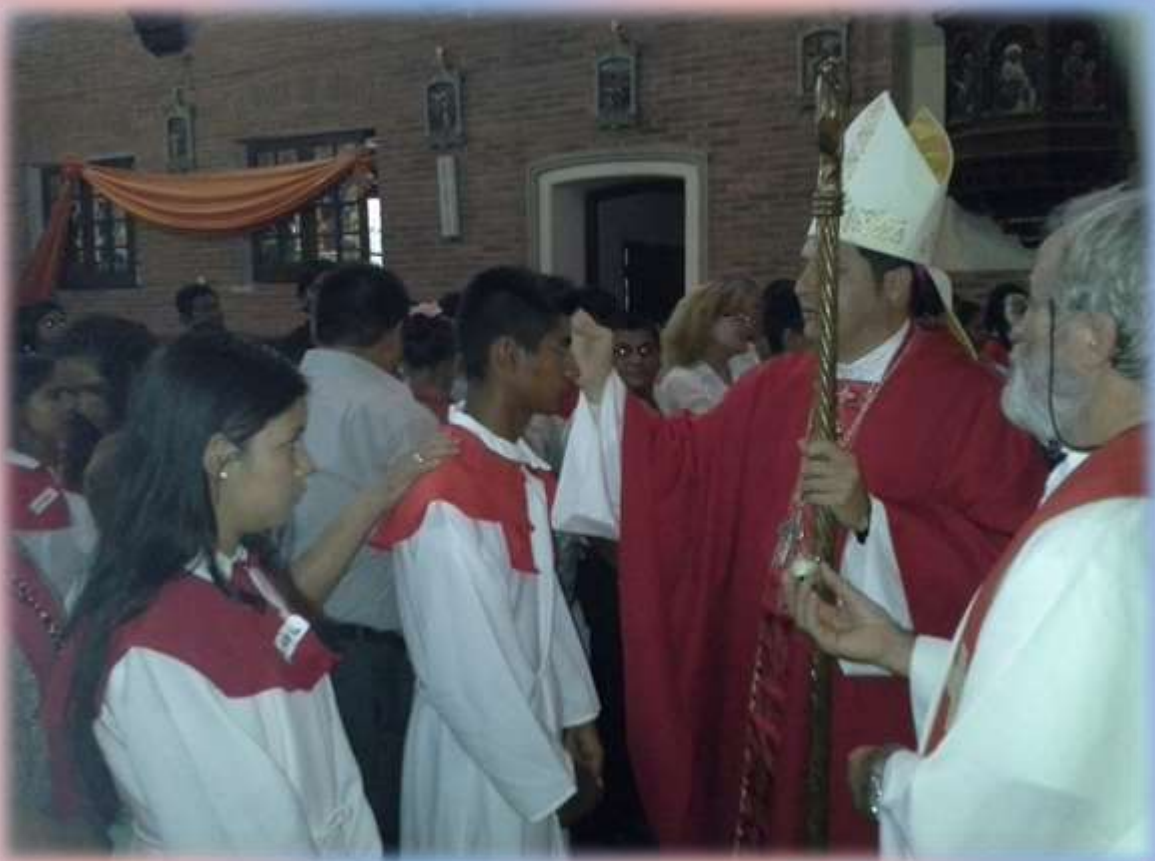
Rito del Sacramento de Confirmación con los jóvenes de la Parroquia San Ramón Nonato de Puerto Casado.