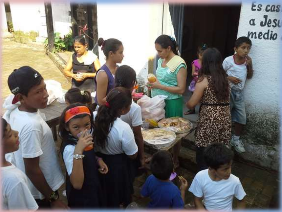
Merienda al término de la misa en homenaje a su Santa Patrona con los niños y pobladores.