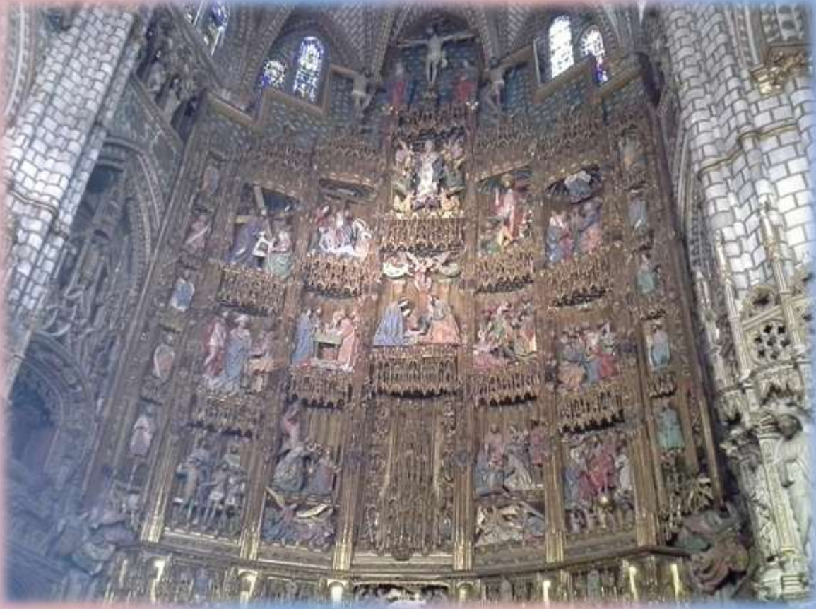
Interior de la Iglesia Catedral de Toledo, España.