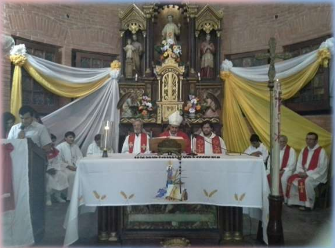
Con la presencia de todos los Misioneros del Chaco en la Parroquia San Ramón Nonato de Puerto Casado se llevó adelante el SACRAMENTO DE LA CONFIRMACIÓN de los jóvenes.