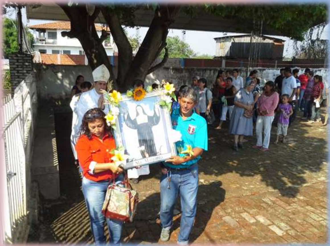
Procesión de los Isleños con su Santa Patrona Santa Margarita María.