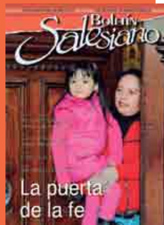
Foto: Madre e hija en la Basílica de María Auxiliadora.

Dirección, redacción y administración: Av. Brasil 218 Breña (Lima-Perú) Teléfonos: (+511) 425-0880 332-8226 / Fax: (+511) 332-1725 Depósito legal: 2001-0722 / E-mail: boletin@salesianos.pe Página web: www.salesianos.pe/boletin Impresión: LETTERA GRÁFICA SAC. CONTACTOS: boletin@salesianos.pe prensa@salesianos.pe