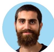
Correzione del testo ITA, invio Marco Fulgaro > RMG