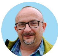
Produzione, contenuto P. Pavel Ženíšek, SDB > RMG