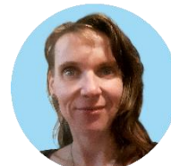
Disegno grafico, layout Martina Mončeková > Praga, Cechia